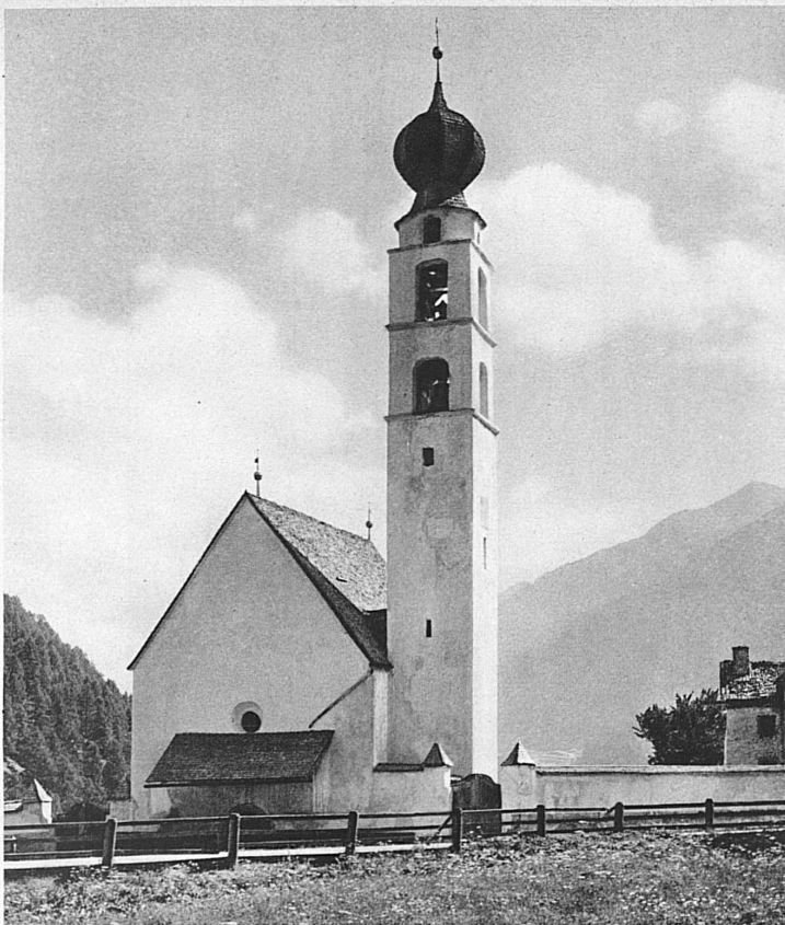
Barockkirche zu Valcava im Münstertal – Eglise du Münstertal

Holz von seinem Holz. Aber überall spürt man den Lehrmeister, der wie das Christentum selbst von Süden her kam. In der soliden Art der Steinfügung, im saubergemauerten Bogen, im Gewölbe, das nicht durch Zierate, sondern nur durch sich selbst wirken will, in der antiken Form des Daches hat er Rätians Bauweise lateinische Formen eingepflanzt. Es sind einfache, in ihrer Armut oft rührende Bauten. Ihr einziger Schmuck ist eine schlichte Bildersprache, manchmal, wie in Zillis, von der flächen Decke herab, oder von den Wänden wie in Waltensburg, Tomils, San Gian bei Celerina, in Poschiavo, Bergün und da und dort noch. Wieviel Schönes mag wohl noch unter der weissen Tünche, die zur Zeit der Reformation die Heiligenbilder zudeckte, verborgen sein?