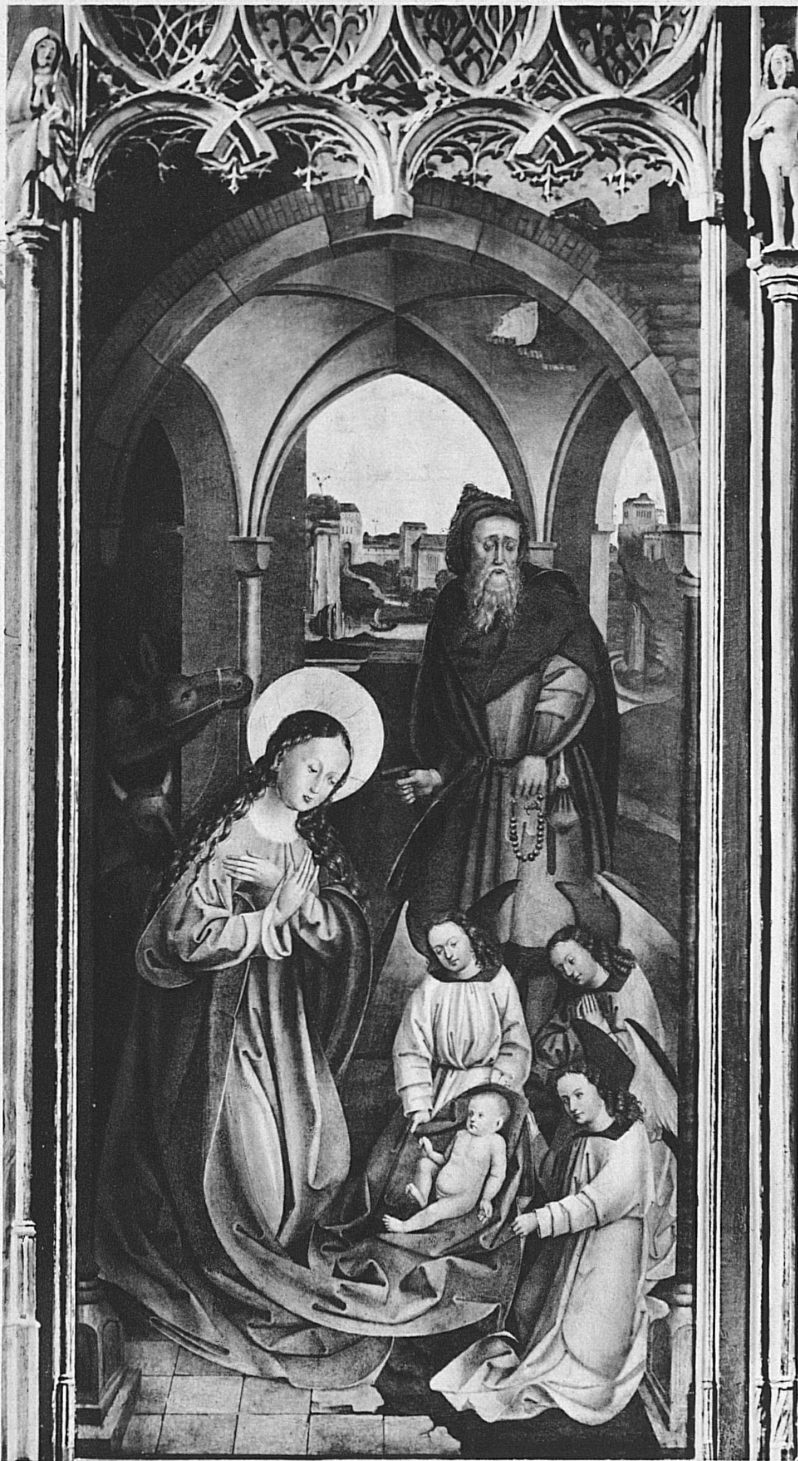
Hochaltarflügel der Churer Kathedrale – Volet du maître-autel de la Cathédrale de Coire