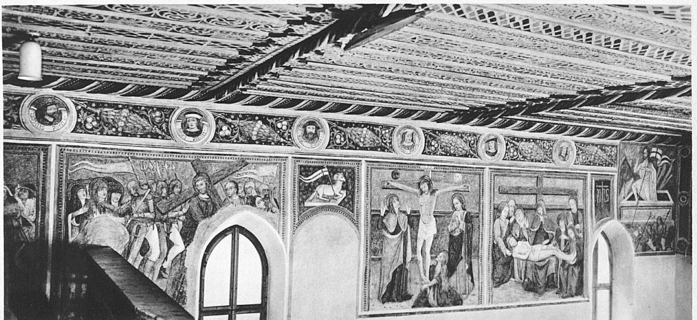
Wandbilder und Holzdecke aus der Kirche Bergün – Peintures murales et plafond de l'église de Bergün