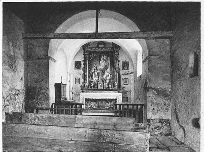
Kircheninneres San Romerio im Puschlav – Autel de San Romerio (Poschiavo)