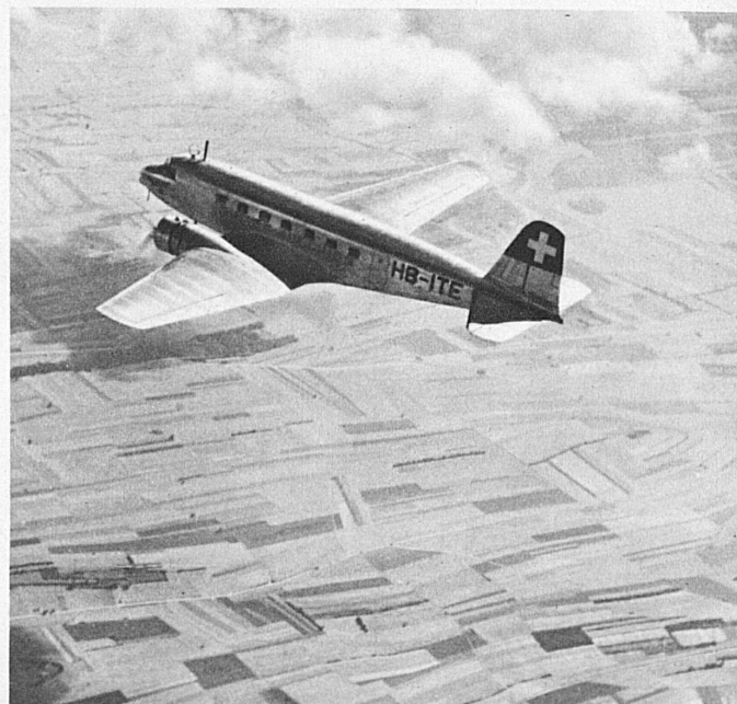
A Swissair Douglas machine high above the plains of Northern France, speeding at 200 m. p. h. towards the Swiss Alps