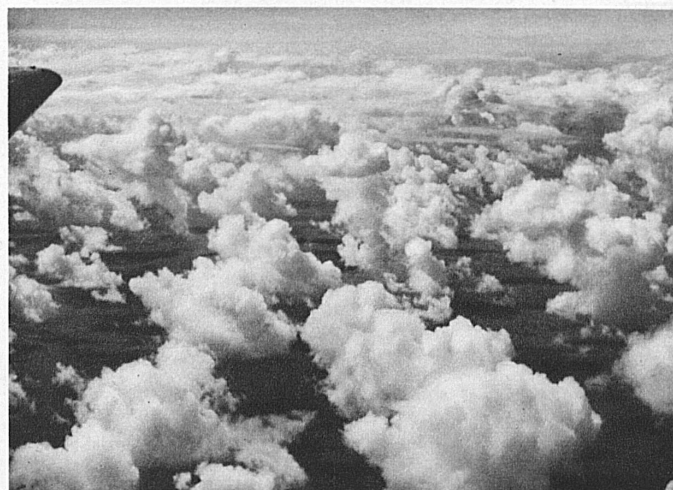
A huge sea of cloud covers the Continent, piercing it, the plane emerges into clear sunshine

Small wonder that visitors to Switzerland are becoming more and more air-minded. They eliminate the long train journey at night and the Channel crossing, thus gaining almost a whole day. The advantage of this need not be commented on, especially for those whose winter holidays are too short. And who ever spent a winter holiday in Switzerland that was otherwise?