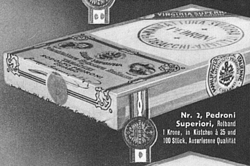
Nr. 2, Pedroni Superiori, Rotband, 1 Krone, in Kistchen à 25 und 100 Stück, Auserlesene Qualität