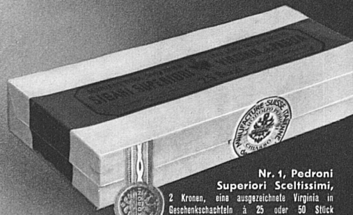
Nr. 1, Pedroni Superiori Sceltissimi, 2 Kronen, eine ausgezeichnete Virginia in Geschenkschachteln à 25 oder 50 Stück

Soll es etwas ganz Besonderes sein, dann die feine Imperial-Virginia Pedroni Nr. 6 in eleganten Zederkistchen à 50 Stück