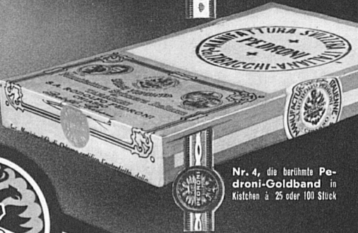
Nr. 4, die berühmte Pedroni-Goldband in Kistchen à 25 oder 100 Stück