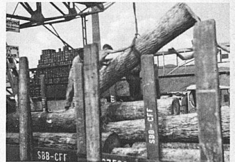
Das Hickoryholz wird aus den Rheinkähnen auf die Eisenbahnwagen umgeladen

Vous pouvez vous procurer au guichet de la gare des bons pour un ou plusieurs voyages en Suisse , et faire sous cette forme de très beaux cadeaux de Noël. Les bons peuvent être établis pour tous les genres de billets. Ceux-ci sont délivrés, sans attestation spéciale, à quiconque se présente avec le bon dans les trente jours.