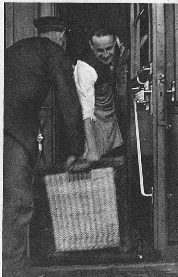
... wo das Personal schon empfangsbereit ihrer Entgegennahme harrt