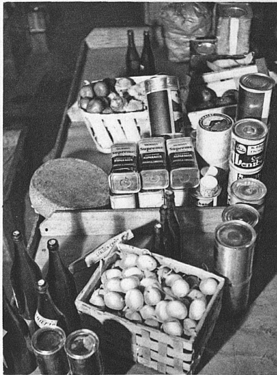
Ein Stilleben? Nein! Das ist ein Teil der Vorräte, die für unsern Speisewagen im Magazin der Gesellschaft bereitstehen ...