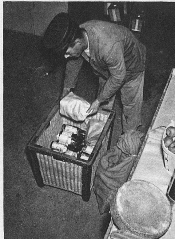
... und schon werden sie von fleissigen Händen zusammengepackt