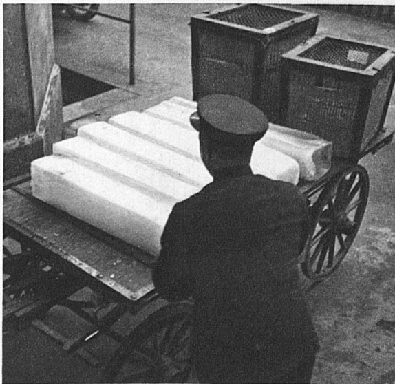
... und die Körbe, auf Karren verladen, wandern in kalter Nachbarschaft der Eisklötze, die jeder Speisewagen mit sich führt, zum Bahnhof ...