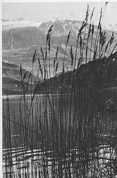
Lac de Géronde