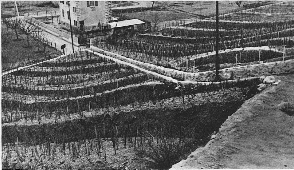
Le vignoble à versanes