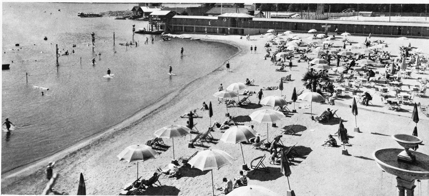
Am 15. April wird das Strandbad Lugano Lido eröffnet – La plage du Lido à Lugano s'ouvrira le 15 avril

Auch Schweizerferien sind heute kein Luxus mehr. Die Anpassung der schweizerischen Hotellerie ist vollzogen. Mit der Eroberung des Winters begann die Offensive der Billigkeit: Von 50 Franken an gab es 7 Tage Winterferien « alles inbegriffen » in einem guten Hotel. Wochenendarrangements konnten in der letzten Saison getroffen werden von 12 und 20 Franken an.