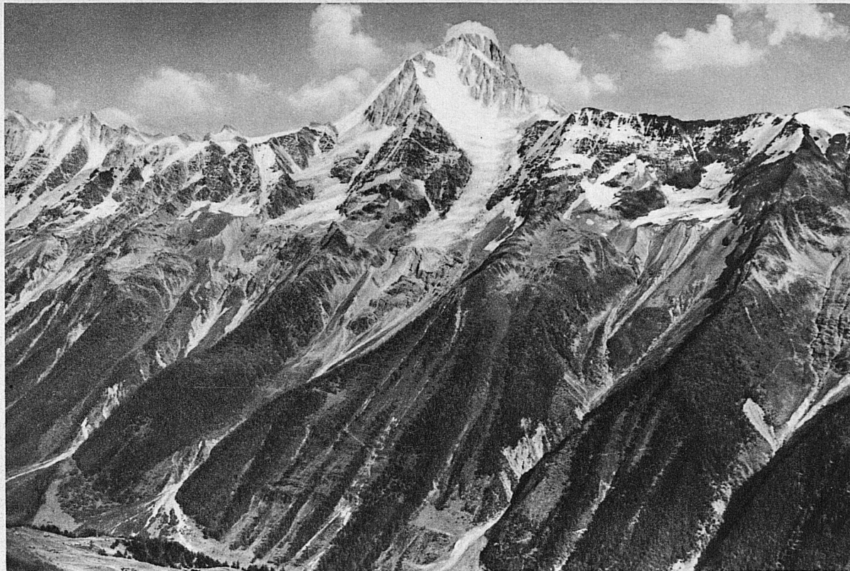
Der Bietschhorn Gipfel überragt mächtig die Kette zwischen Rhonetal und Lötschental