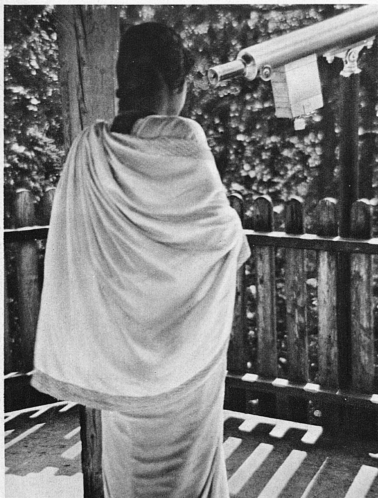
Aus fernen Weltteilen kommen die Gäste in das alpine Schweizer Ferienland. Eine Indierin bestaunt die Jungfrau