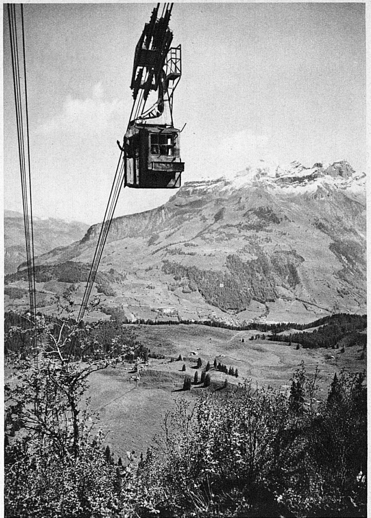
Die Schwebebahn Engelberg – Trübsee

wie ein Fieber zehrt die dumpfe Sommerglut des Tieflandes an Ihrer Kraft. Diese Flucht, die Flucht in die Berge und an die Seen der Schweiz bringt Ihnen den Sieg ein über die Erschlafung und Müdigkeit. Wie Schalen reiner, frischer Luft auf dem Tisch Europas erwarten Sie die Hochtäler, die See- und Gletscherzonen der Schweiz. Wie sollte nicht das Land der Quellen Ihnen jugendliche Kraft schenken können? Wo das Wasser schäumend aus dem Gletschermund springt, wo es lustig und kaltklar das blankgeschliffene Bachbettgeröll überspült, sich stäubend über die Felsenwände stürzt und sich im grünen Talgrund sammelt zum See, da ist auch im höchsten Sommer gut sein.