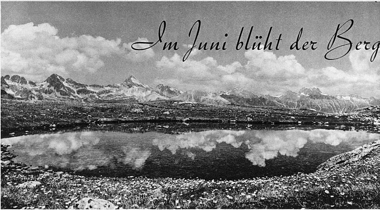
Ein Sommertag im Oberengadin