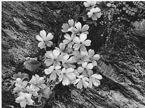
Bergprimeln (Flühl Blumen)

Nah am Schnee, im abgestorbenen und verklebten Herbstgras, steht im Hochgebirgsfrühling die zarteste Bergblume, die kleine Soldanelle zuerst auf; ja, man kann beobachten, wie die feinen ausgefransten Glöckchen die verharstete Schneekruste durchstossen und ihre violetten Kelche über die letzte Winterdecke ins Licht, das sie aus der Erde lockte, emporheben. Ihre Blätter bleiben verborgen. Sparsam wenden sie die Kraft des Bodens und der Sonne einzig der Blüte zu.