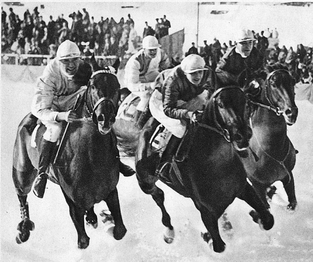
Sur le turf blanc de St-Moritz - Flachrennen auf dem St. Moritzersee

Kandersteg. Curling. L'hôtelier, dont c'est le tour de solder les gin fizz, lâche négligemment: « J'ai ce matin vingt millions sur la glace. » Ce doit être, en effet, la surface fiscale que composent ensemble les six gentlemen à carreaux qu'on aperçoit d'ici agitant leurs balais à curling. La glace, il faut en convenir, vaudrait à elle seule cette somme.