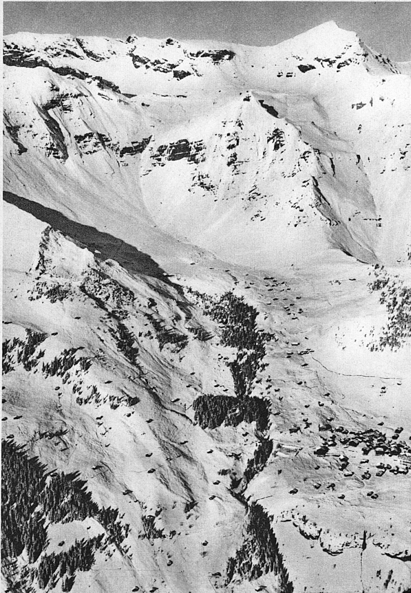
Mürren, théâtre du Kandahar et de l'ASAL - Das Steilabfahrtsgelände von Mürren, der Kampfplatz der akademischen Skiwettkämpfe aller Länder (ASAL)