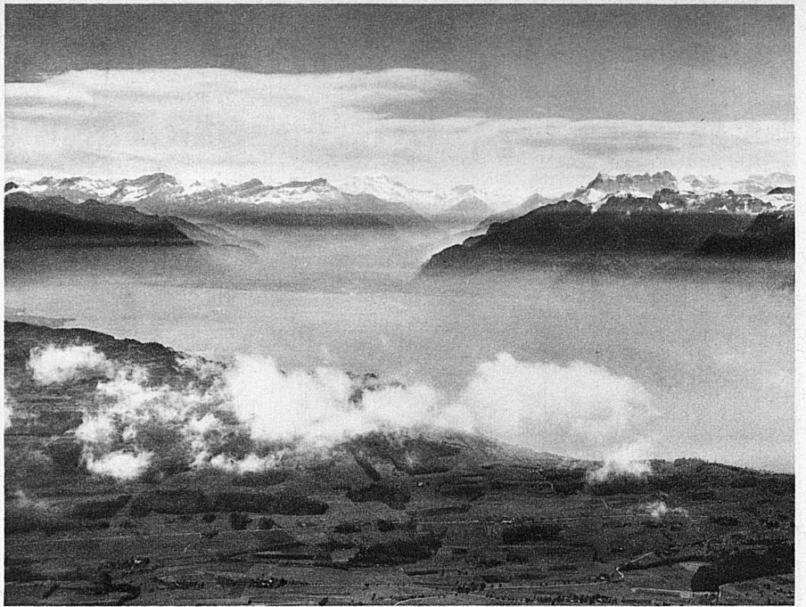
Über dem Gros de Vaud schon öffnet sich in der Flughöhe der Blick über die gewaltige Flut des Genfersees, und weit reicht er hinein in die Gipfelwelt des Mont-blancmassivs, der Dent du Midi und der Walliser Alpen

Die Fluggesellschaft «Alpar» hat den Zweck, die Städte Bern, Lausanne, Biel und La Chaux-de-Fonds/Le Locle an die Eckpunkte des internationalen Luftverkehrs der Schweiz, Zürich, Basel und Genf, anzuschließen. Neuerdings hat sie noch die wichtige Aufgabe übernommen, die schweizerische Quer-Verbindung Genf—Zürich zu sichern.