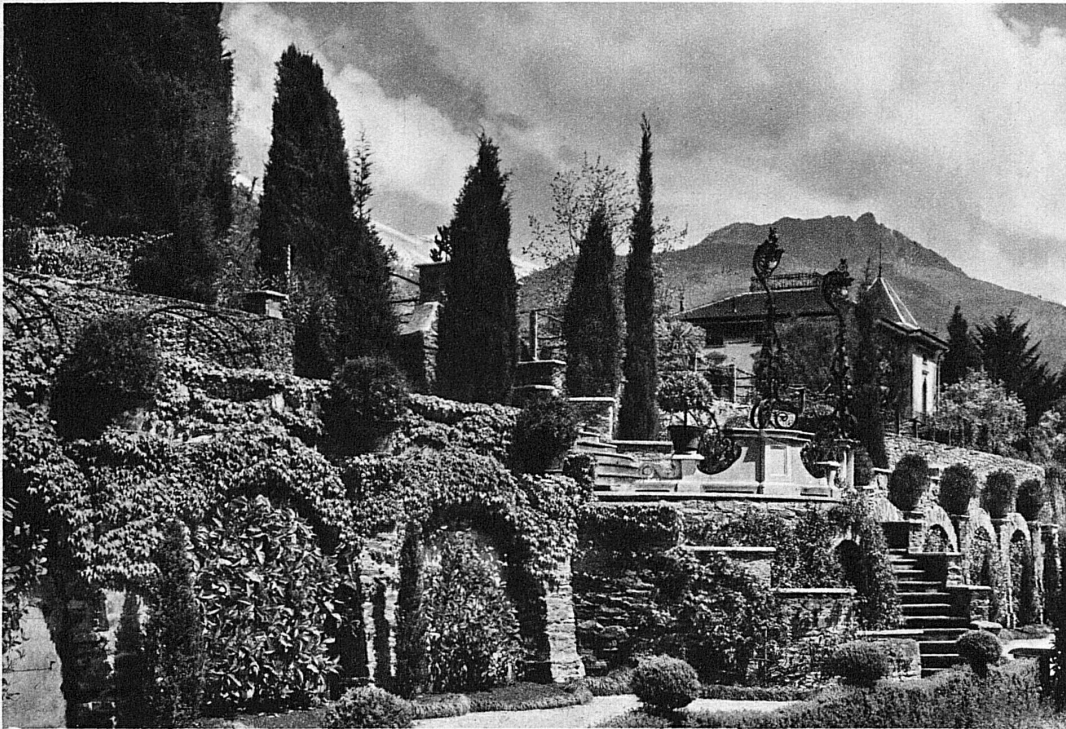
Eine Gartenanlage in Locarno – Jardin à Locarno