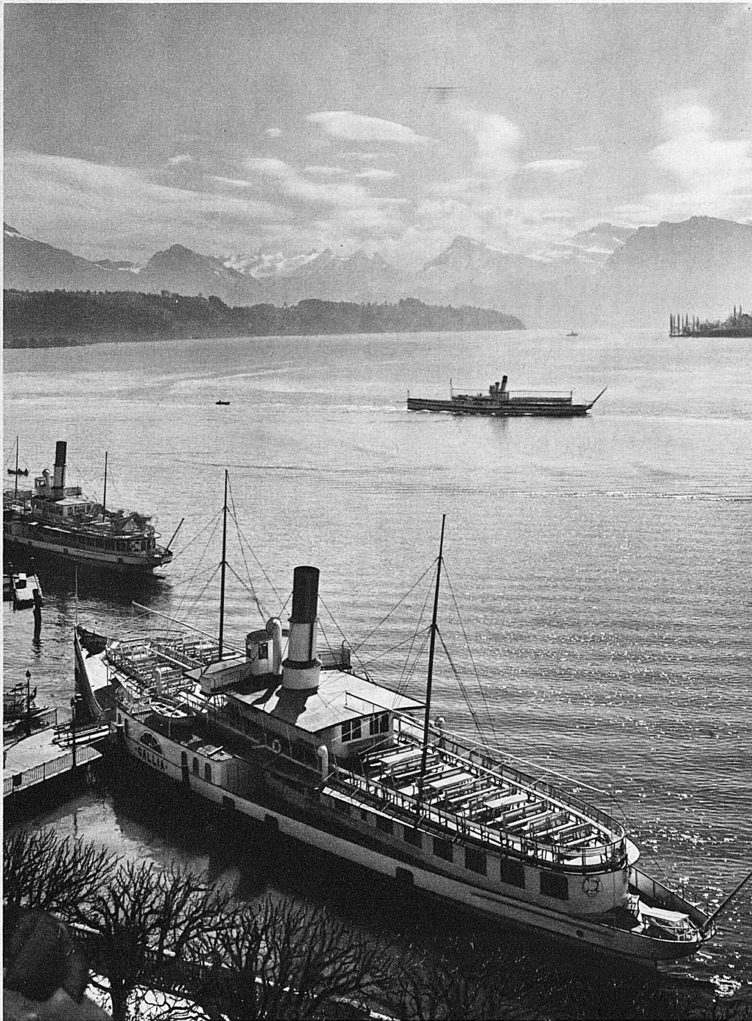
Von Luzern mit dem Dampfschiff über den Vierwaldstättersee – Lucerne, port du Lac des Quatre Cantons

Stehst du neben dem roten Münster auf der Basler Pfalz, so mag der Rheinstrom dich erinnern an die Bäche, die in ausgewaschene Gletscherkehlen stürzen und den Schnee, der unter dem Föhndruck zusammensinkt, schwellend aus den braunen Tälern spülen. In die lautere Frühlingsluft des blühenden Seelandes bringen sie den wilden Geruch der hochalpinen Schneeschmelze.