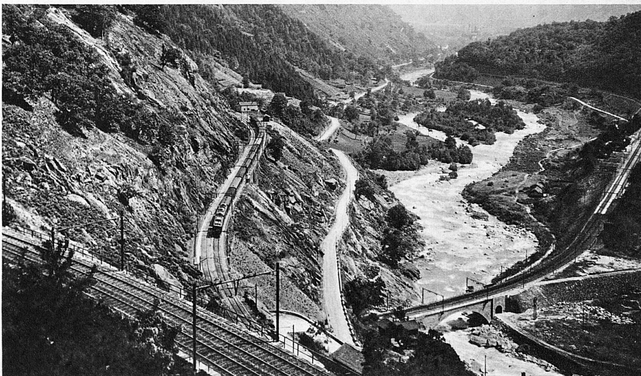
In grossen Kehren überwindet die Gotthardbahn die Talstufe bei Giornico – Les boucles du Gothard sur Giornico en Léventine