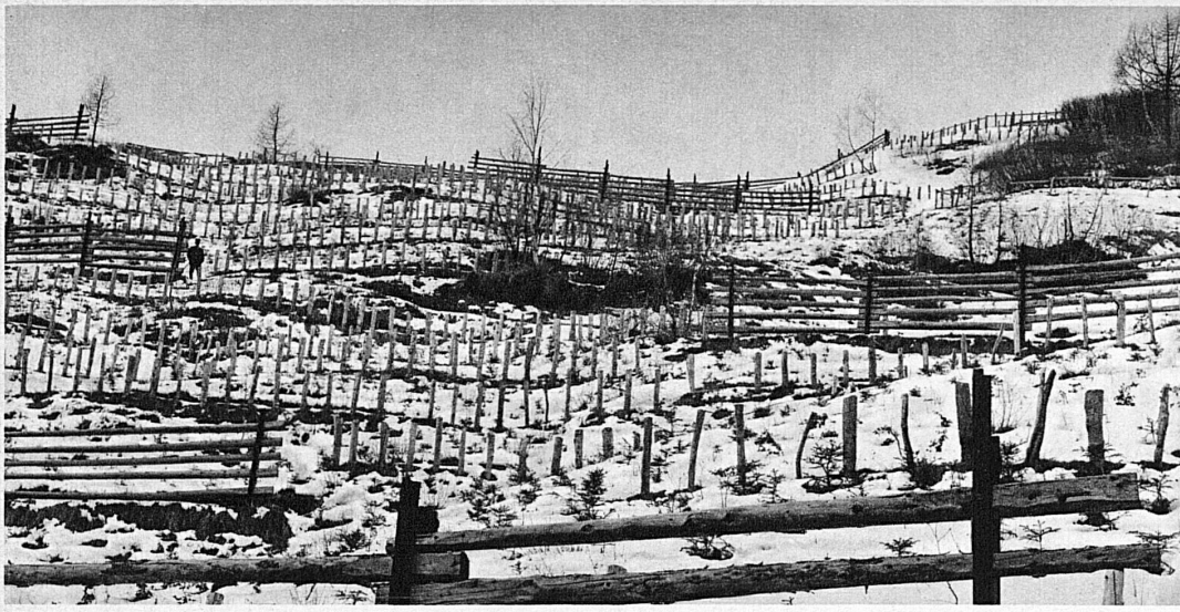
Wie ein Schlachtfeld sehen die Hangverbauungen der Schweizer Alpenbahnstrecken aus – Des « barbelés » en Suisse? Non pas, les travaux de protection des lignes alpêtres