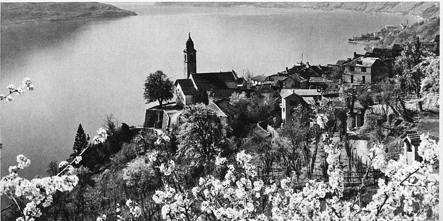
Der Frühling blüht in Ronco – Le printemps fleurit à Ronco

gerader Linie in die Urschweiz, über den See der vier Waldstätte, das Reusstal aufwärts und durch den Gotthard ins Tal des Tessin. Du wirst nicht wie im Flugzeug die Ferne erkennen, soweit das Auge reicht. Aber die Dörfer und Städtchen von der Basellandschaft bis ins Mendrisiotto werden dich grüssen im Wagenfenster der Bahn, die Wellen des Sees werden an dein Schiff schlagen, du wirst die Wildwasser von schwarzfeuchten Felsen und aus schneeatmenden Wäldern rauschen hören, das Südlicht wird dir plötzlich aufleuchten über den noch winterlichen Berggestalten des obern Tessin.