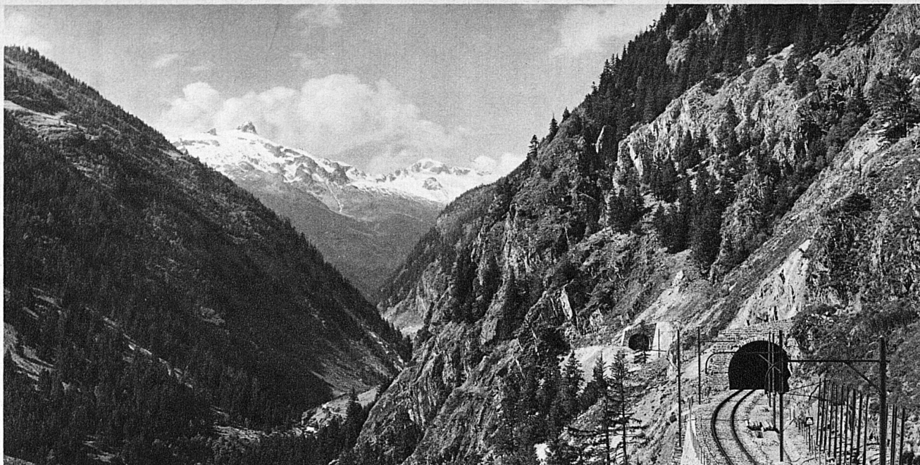
Durch die Lonzaschlucht, auf der Südrampe der Lötschbergbahn ins Wallis – Gorges de la Lonza sur la rampe du Loetschberg, côté Valais