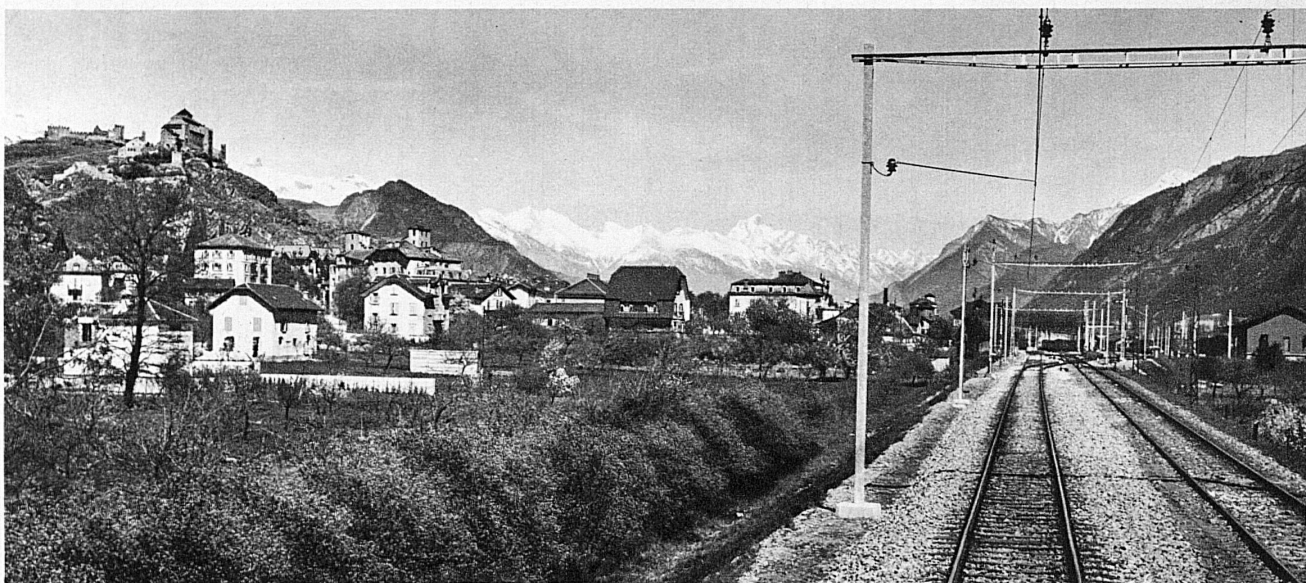
Mit der Simplonbahn durch den Walliser Talfrühling – A travers le premier printemps valaisan par la ligne du Simplon