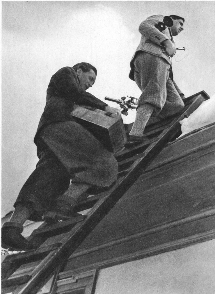
Näher zur Sonne! Mit schweren Präzisionsapparaten beladen, beginnt frühmorgens die Arbeit auf dem Dach des Meteorologischen Observatoriums in Davos — Vers le soleil! Munis de lourds appareils de précision, tôt le matin commence le travail sur le toit de l'observatoire météorologique de Davos