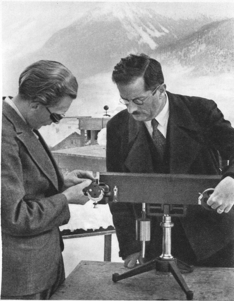
Mit dem Ultraviolett-Doppelmonochromator werden aus dem sichtbaren und unsichtbaren Spektrum der Sonnenstrahlung kleine Bereiche gesondert untersucht - Les doubles monochromator ultraviolets permettent l'examen séparé des spectres visibles et invisibles des rayons solaires sur des surfaces réduites