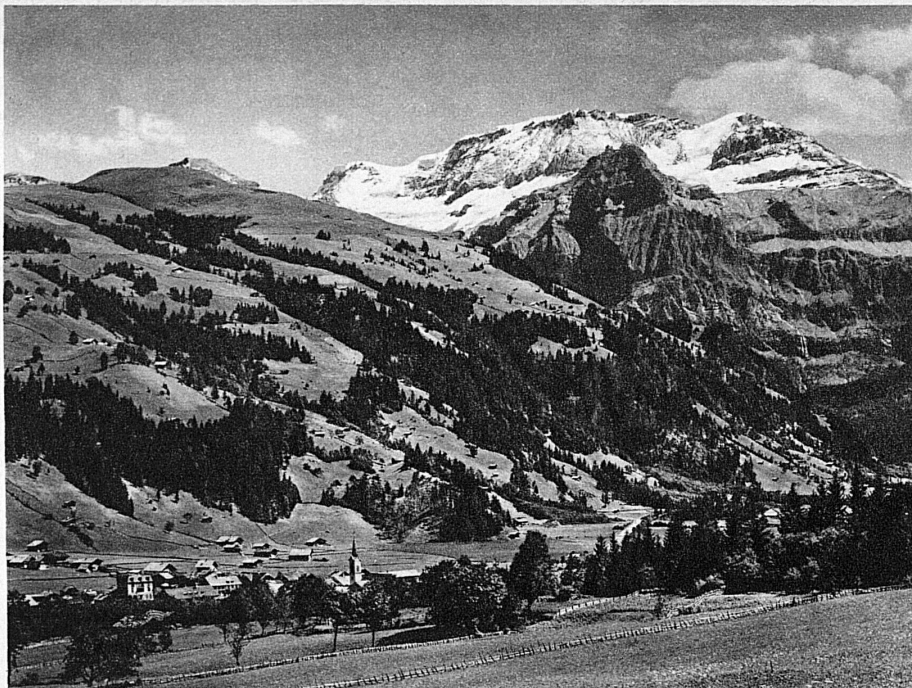
Lenk im Obersimmental und der Wildstrubel – Lenk (Simmental) et le Wildstrubel

Alpweidenland und Vorgebirge, nahe den höchsten Ewig-Schnee-Bergen: das ist das Simmental. Keine beschwerliche Tour, den Grat der Stockhornkette zu erreichen und gegen Norden das Hügelland, den Jura, die Vogesen, gegen Süden aber die Berner, Walliser und Urschweizer Hochalpen in einem freien Rundblick zu erfassen.