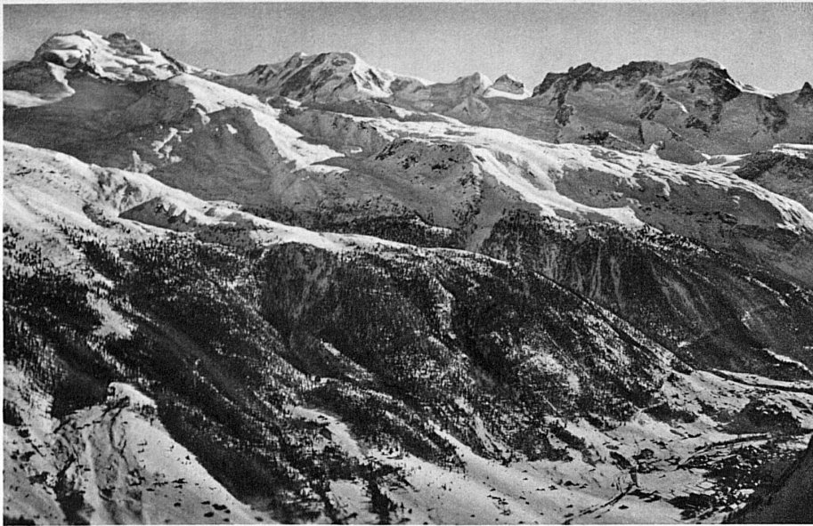
Zermatt und die Gipfel vom Monte Rosa (links) bis zum Breithorn – Zermatt et le massif du Mont-Rose

Grindelwald , im Talkessel zwischen Wetterhorn, Eiger und Faulhorn, zwischen der Kleinen und Grossen Scheidegg, bietet dem Skifahrer, wie kaum ein anderes so begrenztes Gebiet, für Touren, Abfahrten und Training fast unerschöpfliche Möglichkeiten. Vom Talgrund bis Jungfraujoch umfasst es die Höhenlagen zwischen 1000 und 3450 Metern. Kein Wunder, dass sein Sportprogramm Jahr für Jahr bedeutsame und sehr interessante Wettkämpfe versprechen kann. Zwei grosse Skirennen stehen im Januar im Mittelpunkt: die II. Britischen offenen Skimeisterschaften vom 11. bis 13. und die V. kombinierten Abfahrts- und Slalomrennen für Fahrerinnen aller Länder am 18. und 19. Januar. Bei diesem letztern Anlass wird das schweizerische Damenteam für die Olympiade in Garmisch-Partenkirchen bestimmt.