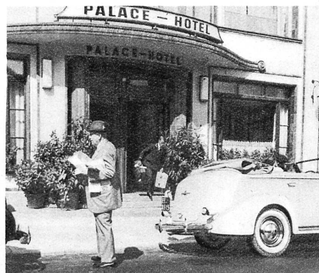
Der amerikanische Zeitungskönig R. W. Hearst in Davos

Zürich - München (Oktoberfest), 3. und 4. Oktober. Fahrpreis ab Zürich Fr. 21.45, St. Gallen Fr. 16.05, Rorschach Fr. 15.15, Romanshorn Fr. 16.05, Frauenfeld Fr. 18.65, Weinfelden Fr. 17.55.