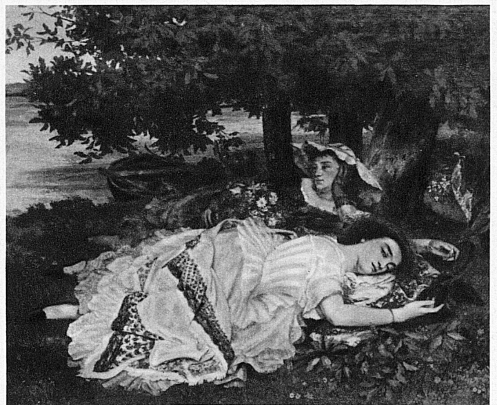
(en haut) « Les Demoiselles des bords de la Seine » (1854)