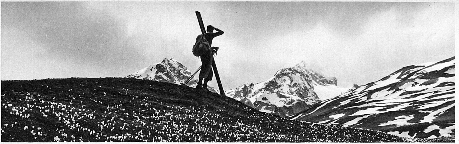
Adieu à l'hiver - Skifahrers Abschied vom Winter