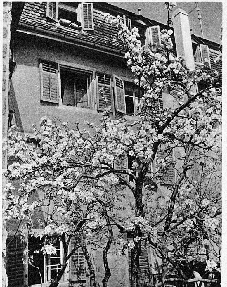
Pommiers en fleurs à Mellingen - Baumblust in Mellingen (Aargau)