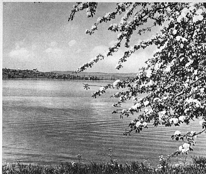
Le Bodan près de Steckborn – Am Untersee bei Steckborn