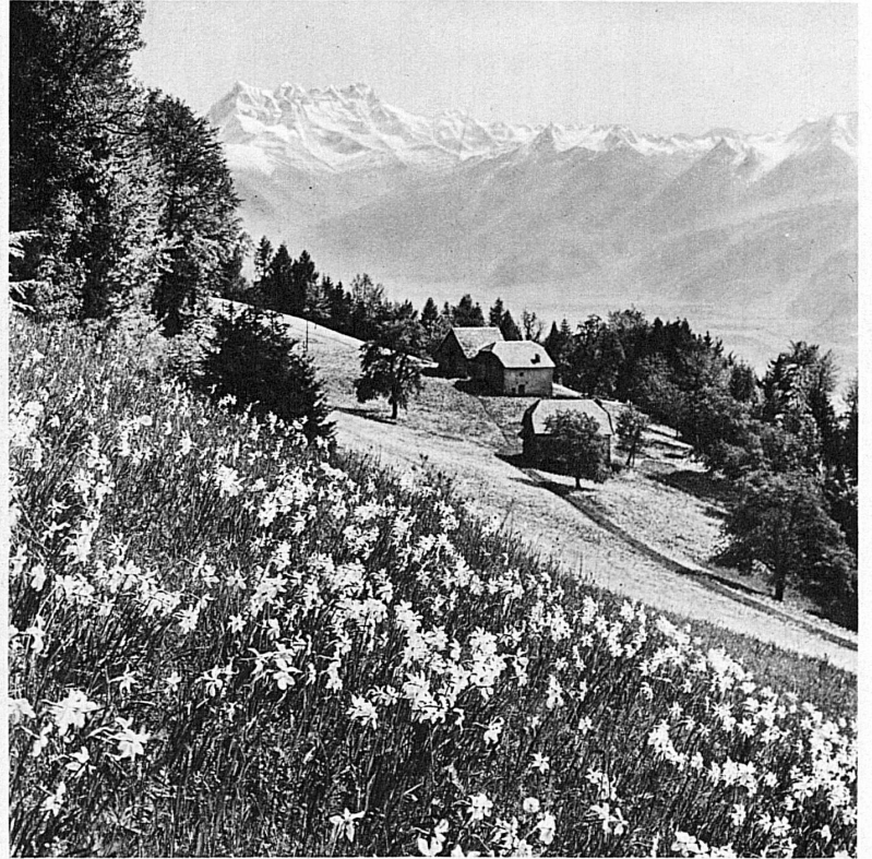
Champs de narcisses près de Montreux - Narzissenfelder am Genfersee