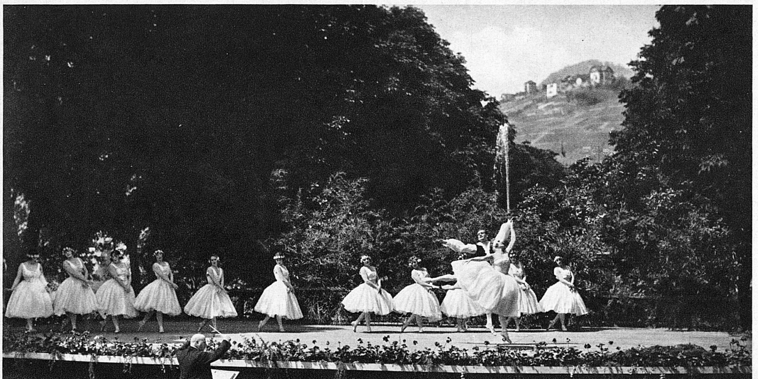
Visions de grâce à Montreux – Festzauber in Montreux

nature d'Ile-de-France, où l'on dirait que toute chose, prés et futaies, est saupoudrée d'une cendre d'histoire, Corot, le virtuose des gris, s'est extrêmement complu dans l'atmosphère du Léman, au pays de Genève, où il retrouvait les délicatesses d'enveloppe et les vibrations argentées qu'il affectionnait sur tout. Courbet, qu'on célèbre actuellement à Zurich, pour avoir contemplé ce même lac avec les regards irrités du proscrit, ne l'a pas saisi en violence. On dirait au contraire, dans ses ouvrages de la fin, que la féminité du Léman a plutôt désaxé sa pensée si virile et ramolli sa robuste palette. Dans ce pays où l'on lave les façades des chalets à l'eau de soude, où la nature et les coutumes semblent imbus d'une sorte de propreté axiomatique, et qui par là se trouverait, si l'on veut, en médiocre position picturale, attendu qu'en peinture le sale et le brouillé valent mieux que le propre, ce sont les lacs qui donnent l'enveloppe, l'estompe et le chatolement. Ces lacs, dont elle a plus de mille de tout format, des petites mers du Bodan, du Léman, aux vasques minuscules cachées dans une fossette des alpages, sont répandus partout sur la