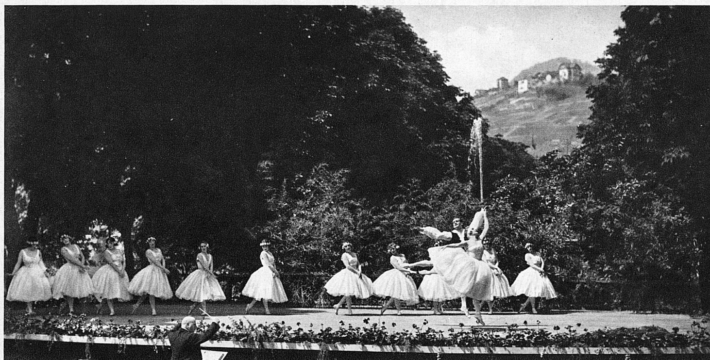
Visions de grâce à Montreux – Festzauber in Montreux

Dans ce pays où l'on lave les façades des chalets à l'eau de soude, où la nature et les coutumes semblent imbus d'une sorte de propreté axiomatique, et qui par là se trouverait, si l'on veut, en médiocre position picturale, attendu qu'en peinture le sale et le brouillé valent mieux que le propre, ce sont les lacs qui donnent l'enveloppe, l'estompe et le chatolement. Ces lacs, dont elle a plus de mille de tout format, des petites mers du Bodan, du Léman, aux vasques minuscules cachées dans une fossette des alpages, sont répandus partout sur la