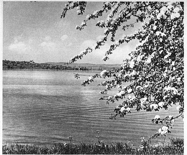
Le Bodan près de Steckborn – Am Untersee bei Steckborn