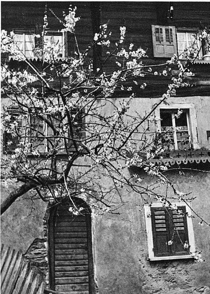
Printemps dans les Montagnes valaisannes - Frühling im Wallis