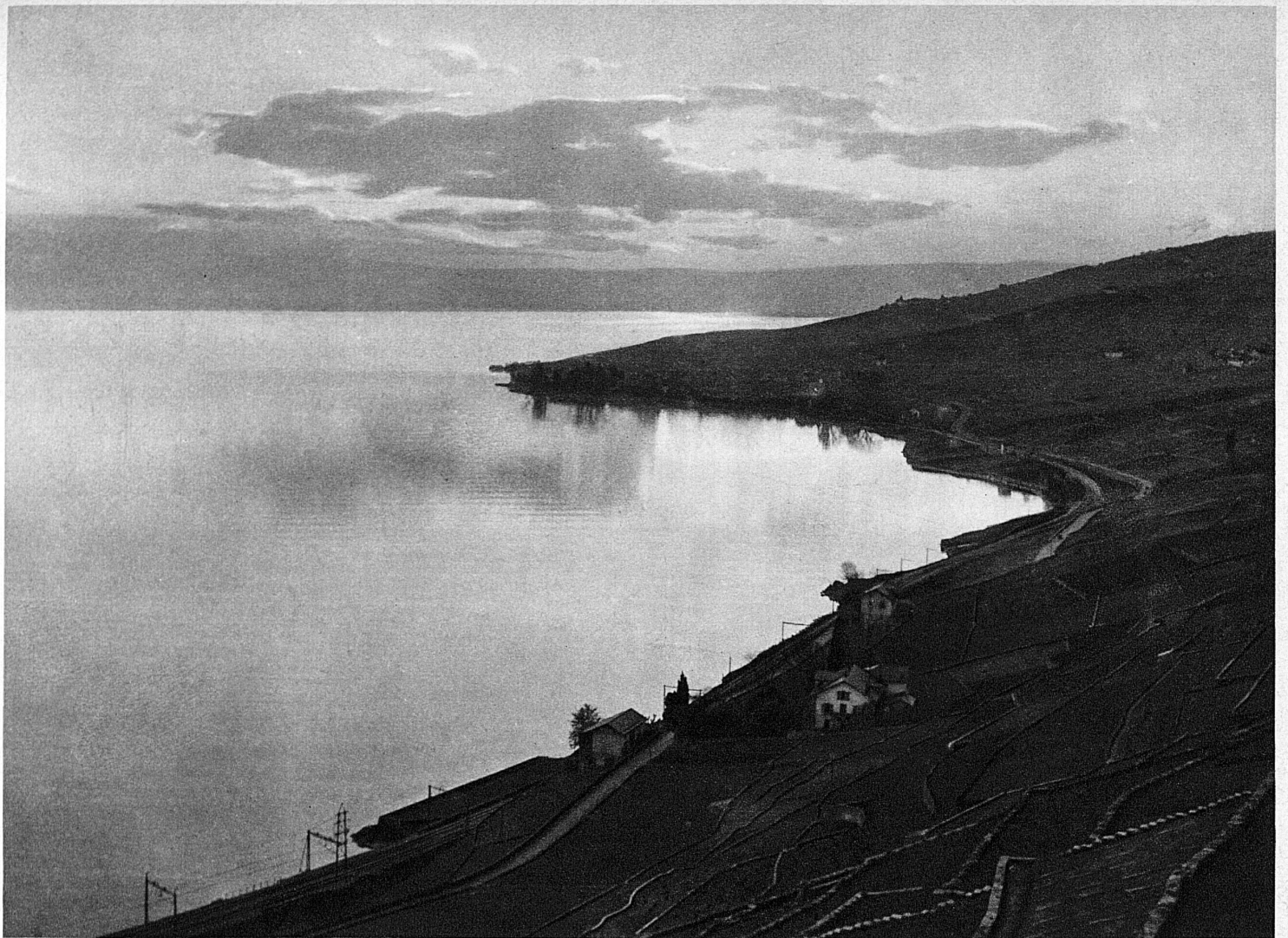
Coucher du soleil sur le Léman - Sonnenuntergang am Genfersee