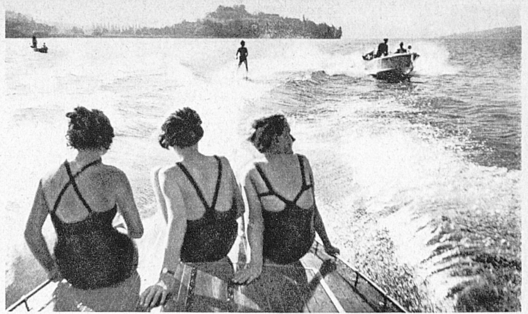
Joies nautiques sur le Lac de Zurich — Wasserfreuden auf dem Zürichsee