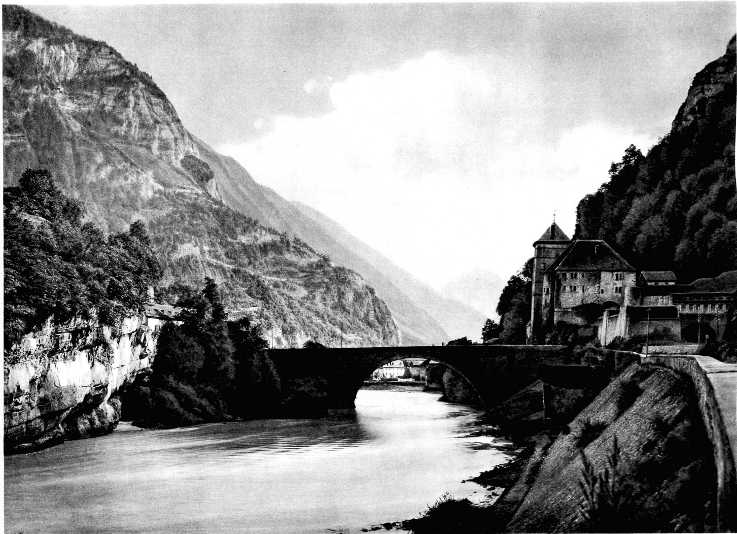
Le défilé de Saint-Maurice — Schloss und Brücke von Saint-Maurice, an der Grenze von Wallis und Waadt