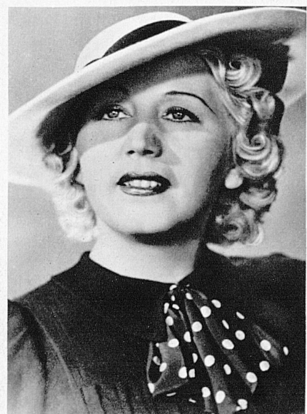
Erna Sack von der Dresdener Staatsoper wird man in «Massimilla Doni» und in der «Fledermaus» hören