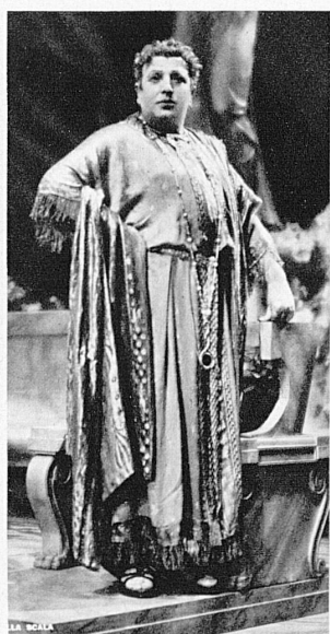
Aureliano Pertile, der berühmte Heldentenor der Scala, singt die Titelpartie des «Nerone»