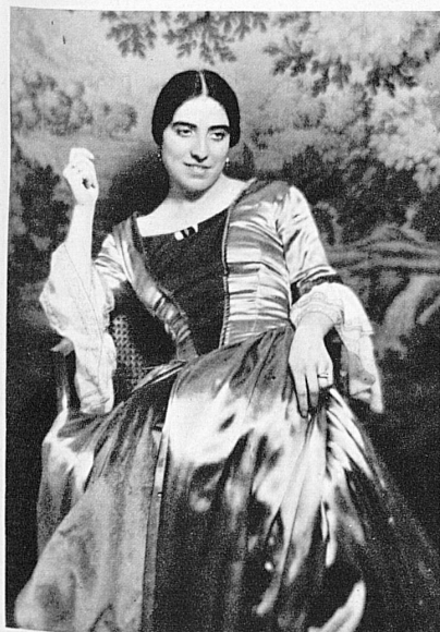
Dusolina Giannini, die grösste lebende Tragödin Italiens, singt die Partie der Tosca und der Butterfly