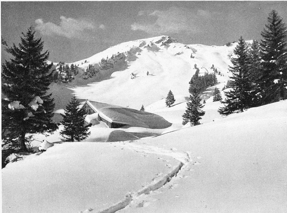
Im Jental bei Nesslau (Toggenburg) – La petite vallée du Jental près de Nesslau (Toggenburg)