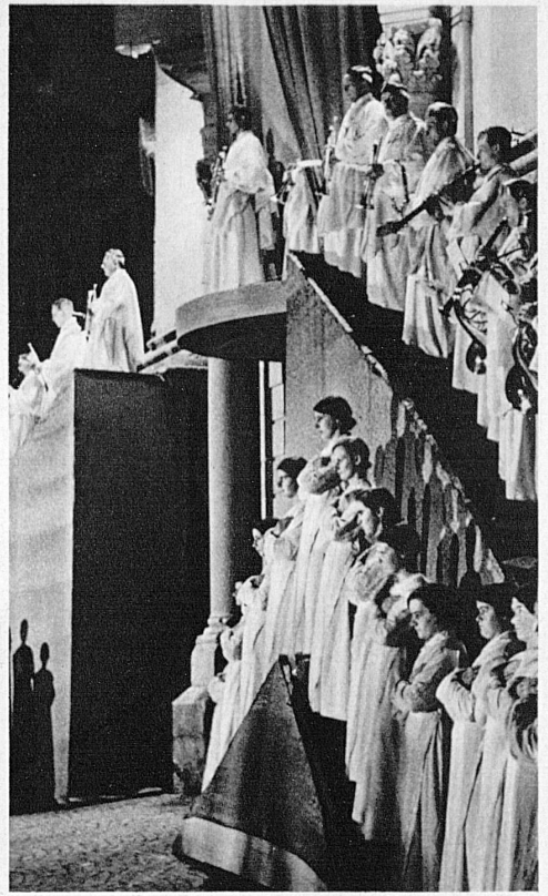
Die nächtliche Fassade der Einsiedler Klosterkirche und «Das grosse Welttheater» von Calderon mit seinem himmlischen und seinem irdischen Schauplatz – Scènes du «Théâtre du Monde» de Calderon, joué devant l'Abbaye de Notre-Dame des Ermites, à Einsiedeln – La facciata della Chiesa abbaziale di Einsiedeln, di notte, durante la rappresentazione di «Il gran teatro del mondo» di Calderon con le sue scene terrestri e celesti – Nocturnal view of the façade of Einsiedeln Monastery Church and Calderon's «Das grosse Welttheater» with its heavenly and worldly scenes