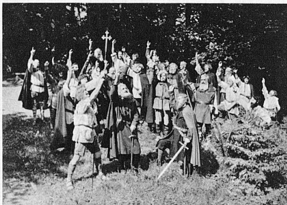
Der Rütli Schwur – Le serment du Gruiti – Il Giuramento del Rütli – The «Rütli Schwur», Confederates' Oath