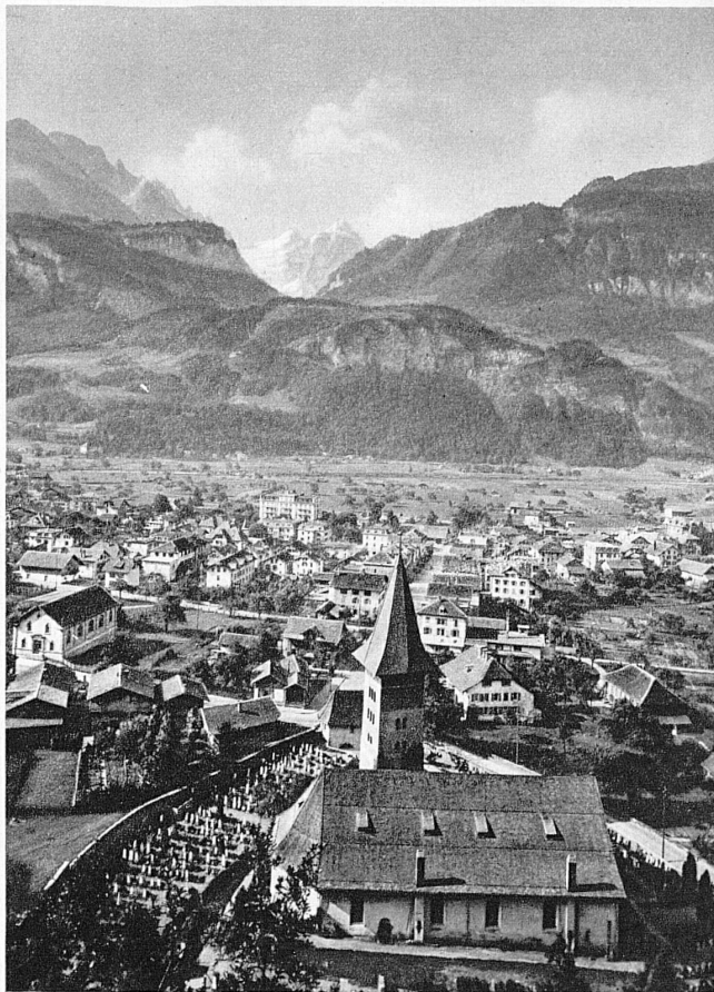
Meiringen, der Schauplatz der Freilichtspiele Oberhasli – Meiringen, où des représentations en plein air ont lieu cet été – Meiringen, dove si svolgono gli spettacoli all'aperto dell'Oberhasli – Meiringen, where the Oberhasli open-air plays are held