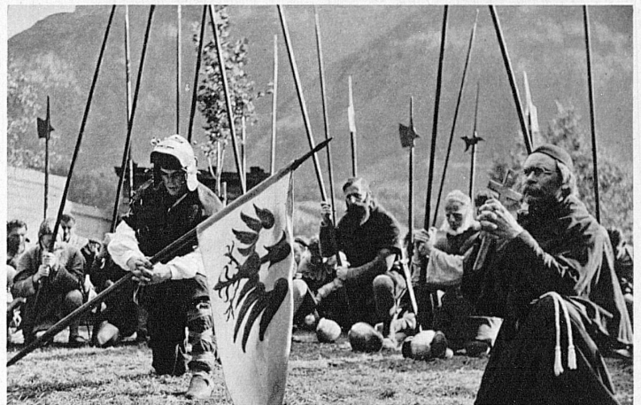
Eine Szene aus «Isen im Fiiir», das auch dieses Jahr in Meiringen gespielt wird – Une scène de «Isen im Fiiir» qui sera repris cette année à Meiringen – Una scena di «Isen im Fiiir» («Ferro sul fuoco») che si rappresenta anche quest'anno a Meiringen – A scene from «Isen im Fiiir», which will again be played in Meiringen this year