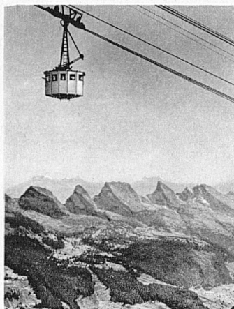
Säntis-Schwebebahn mit Blick auf die Churfirsten

Auskunft durch die Reisebureaux, SBB-Bahnhöfe oder Betriebsdirektion in Vitznau. Telefon Nr. 60.002