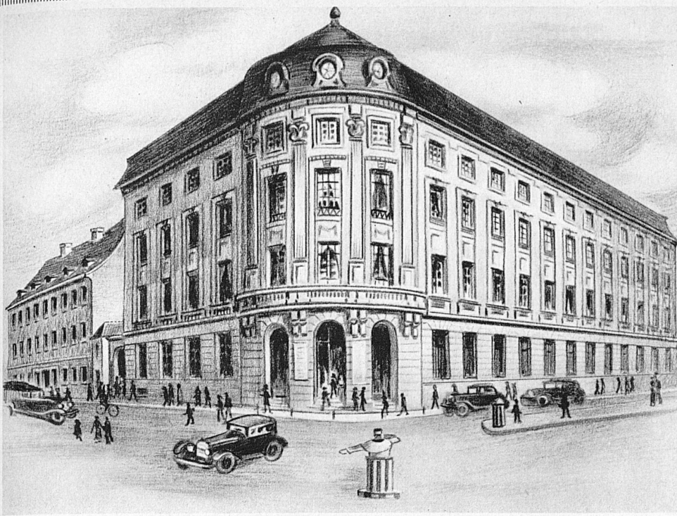
Gesellschaftssitz in Basel . Siège social à Bâle