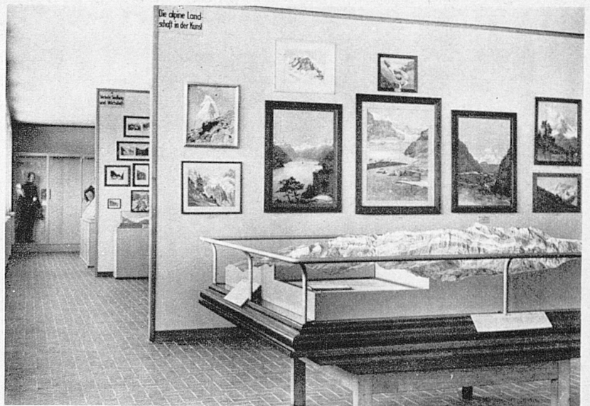
Saubere Museumstechnik zeigt das Alpine Museum in Bern

Gewässer und Seen erhielt im gleichnamigen Museum in Zug eine Stätte.