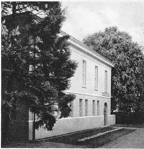
Der Neubau des 1929 eröffneten Bündner Naturhistorischen- und Nationalparkmuseums in Chur