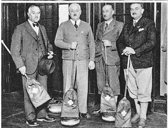
Oben: Die Berner Oberländer Mannschaft - En haut: L'Equipe de l'Oberland bernois Unten: Die Engadiner - En bas: Ceux de l'Engadine