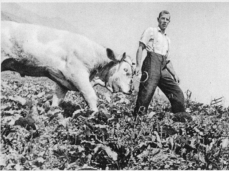
Auf einer Alp am Niesen – Sur un alpage du Niesen