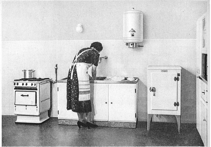
Gasherd, Gasboiler und Gas-Kühlschrank: Die ideale Küchenausstattung für den modernen Haushalt. Cuisinière à gaz, boiler à gaz et armoire frigorifique à gaz: installation de cuisine idéale pour le ménage moderne.