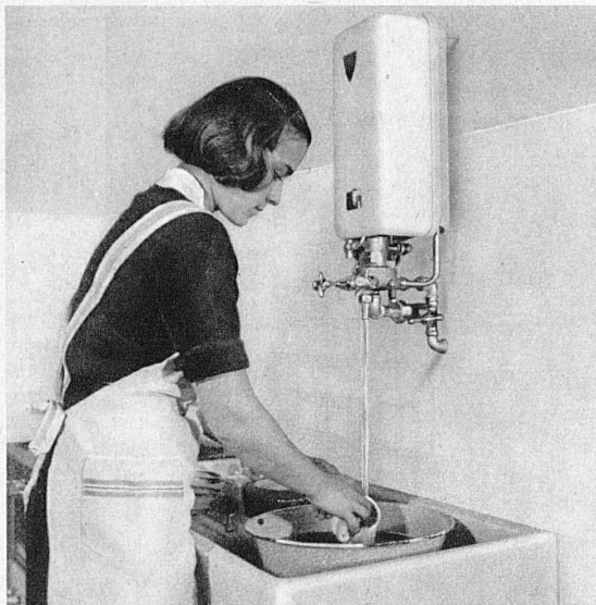
Der billige Gas-Kleinautomat spendet für die Küche reichlich heisses Wasser zu jeder Zeit. Le petit chauffe-eau instantané à gaz est bon marché et fournit en tout temps toute l'eau chaude nécessaire à la cuisine.