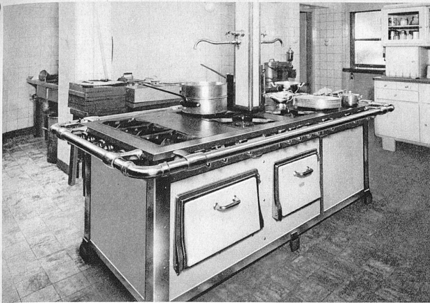
Über 3400 Gas-Grossküchen sind in schweizerischen Hotels, Restaurants und Anstalten in Betrieb! En Suisse, plus de 3400 grandes cuisines à gaz sont exploitées dans les hôtels, restaurants et établissements hospitaliers!