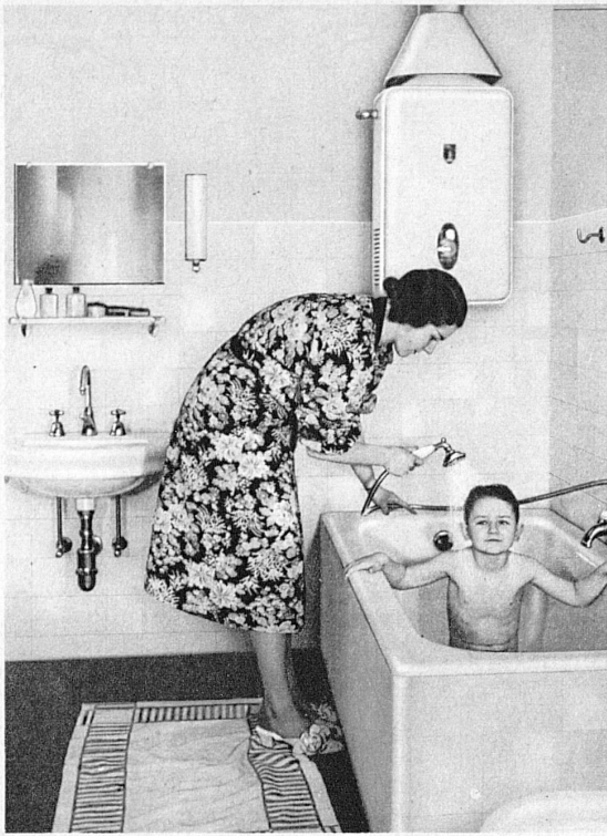
Gas-Automaten und Gas-Badeöfen, die unerschöpflichen Heisswasserbereiter, sind modern, sparsam und stets zuverlässig. Les chauffe-eau automatiques et chauffe-bains à gaz modernes sont des producteurs d'eau chaude inépuisables, économiques et de fonctionnement sûr.