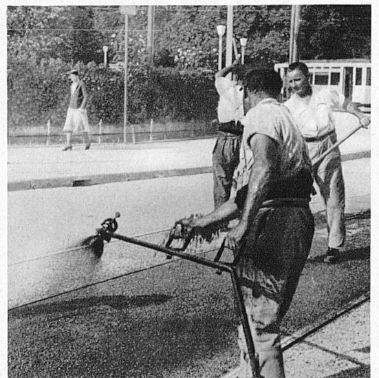
Schweizer Gaswerksteer dient zum Strassenbau und als Rohstoff für unsere chemische Industrie. Le goudron suisse des usines à gaz sert dans la construction de routes et de matière première à notre industrie chimique.