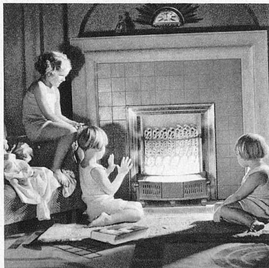
Die Gasheizung arbeitet rasch, sauber und bequem, sie ist heute besonders wirtschaftlich. Le chauffage au gaz est rapide, propre et pratique, il est aujourd'hui tout particulièrement économique.