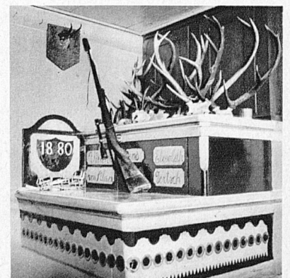
Rechts: Jäger-Ecke in einem Berner Oberländer Haus — Le « coin du chasseur » d'une maison de l'Oberland bernois — The hunter's corner in a Bernese Oberland chalet — L'angolo dei cacciatori in una casa dell'Oberland bernois