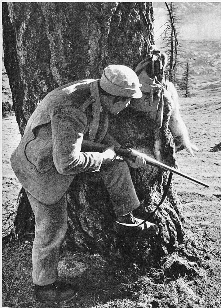
Auf der Hasenjagd — Chasse au lièvre — Hunting the hare — Alla caccia della lepre