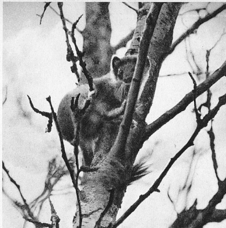
Baummartener — Martre des bois — Pine-martens — Martora