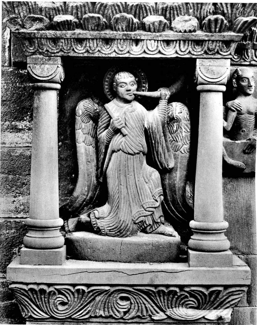
Engel des Jüngsten Gerichts an der Gallusporte des Basler Münsters - Anges du Jugement dernier au portail de St-Gall de la Cathédrale - Doomsday Angel on the Gallus Portal of Basle Minster - Angeli del Giudizio universale, sul portale di Gallo della Cattedrale basilese

Parmi les sculptures qui ornent les églises, les portes et les fontaines de la ville de Bâle, celles qui représentent des musiciens ont un charme tout particulier, car elles nous donnent un aperçu de la vie musicale et du sentiment de la musique des siècles passés. Du Jugement dernier surmontant le portail de St-Gall (du 12 e siècle) et du chasseur du contrefort de la nef transversale nord de la Cathédrale, aux anges ogivaux du Spalentor et de la fontaine du Marché aux poissons, aux légères muses de la fontaine du «Rebhaus» et au musicien ambulant, c'est toute l'évolution occidentale de la conception de la vie qui se manifeste, partant de l'ascétisme du Haut-Moyen-Age pour aboutir à la joie de vivre et aux plaisirs de la Renaissance.