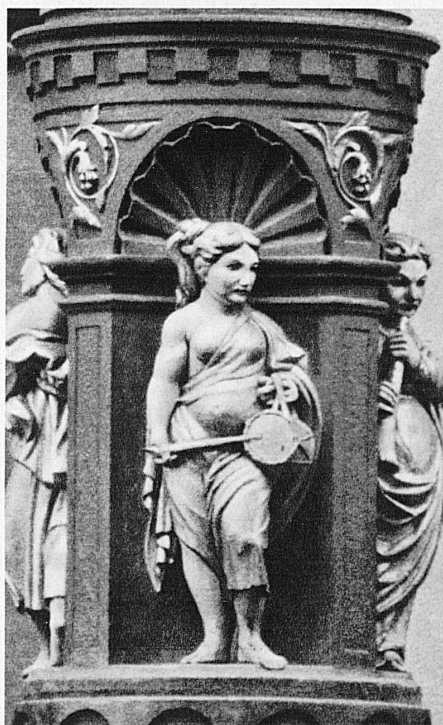
Muse mit kleiner Trommel, vom Rebhausbrunnen - Muse au petit tambour de la fontaine du «Rebhaus» - Muse with drum, «Rebhaus» Fountain - Musa con tamburo sulla fontana del «Rebhaus»