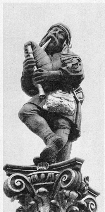
Dudelsackbläser auf dem Holbeinbrunnen - Joueur de cornemuse de la fontaine Holbein - Bagpipe-player on the Holbein Fountain - Suonatore di cornamusa sulla fontana di Holbein