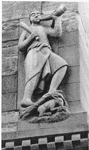
Jäger am Strebepfeiler des Nordquerschiffes des Basler Münsters - Un chasseur du contrefort du transept de la Cathédrale de Bâle - Hunter on the north transept buttress of Basle Minster - Cacciatore su un pilastro della navata trasversale nord della Cattedrale basilese

sie zu Füßen der Madonna mit dem Kinde und versammeln dabei das ganze Instrumentarium der gotischen Zeit. In Basel entstanden in unmittelbarem Zusammenhange von 1420—1428 die fünf Engel an der Konsole der Madonna