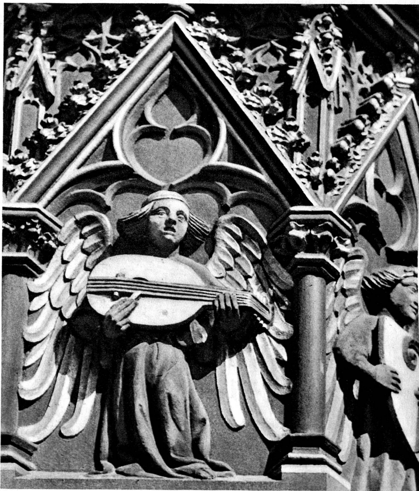
Laute spielender Engel am Fischmarktbrunnen - L'ange au luth de la fontaine du Marché aux poissons - Angelic lute-player on the Fish-Market Fountain - Angeli che suonano il liuto sulla fontana del Mercato dei pesci