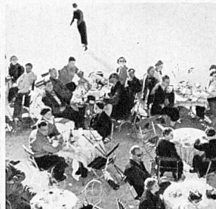
Un après-midi ensoleillé à la Petite Scheidegg (Oberland bernois) - Sonnige Nachmittagsstunde auf der Kleinen Scheidegg im Berner Oberland - Sunny afternoon at the Kleine Scheidegg, Bernese Oberland - Pomeriggio di sole sulla Kleine Scheidegg nell' Oberland bernese