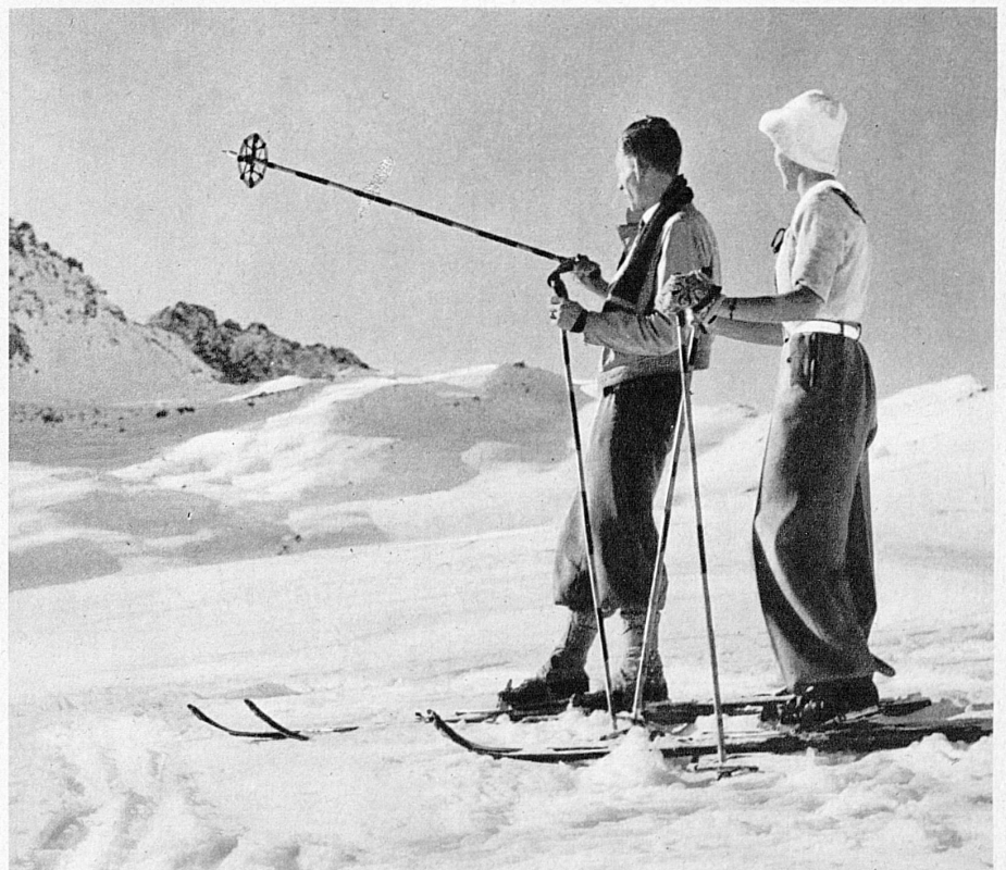
Au paradis des skieurs d'Arosa (Grisons) - Im Skiparadies von Arosa, Graubünden - The glorious ski-ing grounds of Arosa, Grisons - Arosa (Grigioni), paradiso degli sciatori