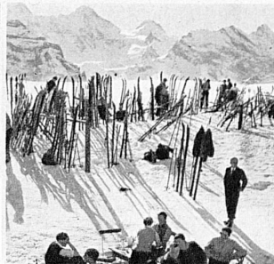
Jour de grande affluence au Männlichen (Oberland bernois) - Hochbetrieb auf dem Männlichen bei Grindelwald und Wengen im Berner Oberland - Ski-ing in full swing on the Männlichen, a fine run in the Bernese Oberland - Il Männlichen presso Grindelwald e Wengen è la meta preferita di folle di sciatori