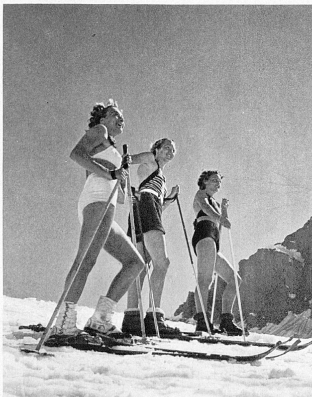
Un bain de soleil en ski. Petite Scheidegg (Oberland bernois) - Ein Sonnenbad auf Ski. Kleine Scheidegg, Berner Oberland - Sunbathing on skis. Kleine Scheidegg, Bernese Oberland - Bagno di sole sugli sci. Kleine Scheidegg (Oberland bernese)

Vous comprenez alors ces milliers et milliers de skieurs qui prennent d'assaut les trains de week-end pour se répandre sur les flancs de la montagne, d'un bout à l'autre de la Suisse, et les airs vainqueurs qui se lisent au retour sur leurs visages halés, et l'allure souple et joyeuse qu'ils conservent ensuite dans le train-train journalier. Tous les embêtements de la plaine se fondent au soleil de leurs glorieux dimanches. Et vous comprenez aussi que ce n'est pas un mot, un slogan de réclame, quand on nous répète sur tous les tons que les vacances d'hiver en Suisse sont les plus belles vacances du monde.