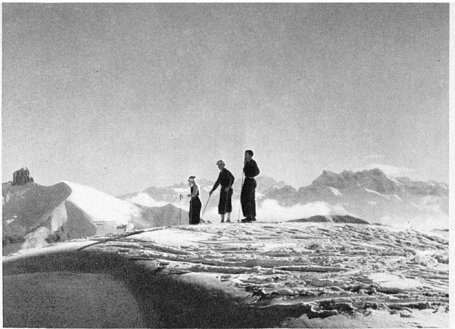
Vue des Rochers de Naye près Montreux (2045 m) sur les sommets de la Tour de Mayen, de la Tour d'Aï et des Dents du Midi - Der Blick von den Rochers de Naye ob Montreux (2045 m) auf die Gipfel der Tour de Mayen, Tour d'Aï und Dents du Midi - View from Rochers de Naye (above Montreux 6340 ft.) towards the summits of Tour de Mayen, Tour d'Aï and Dents du Midi - Le cime della Tour de Mayen, Tour d'Aï e Dents du Midi viste dai Rochers de Naye sopra Montreux (2045 m)

Mit den längern Nächten nämlich, in denen die tiefverschneiten Berge ihr letztes Restchen Wärme in den Weltraum ausstrahlen, setzt auch schon ein höchst wohltätiger Vorgang ein: die kalte Luft gleitet langsam und stetig an den Bergflanken zur Tiefe und kauert nun unten, fern, verborgen in Talwannen und unter der Perlmutterdecke des Nebelmeeres. Darüber aber erfüllt herrliche Klarheit die weiten Räume; das Fernste ist in die Nähe gerückt, und in weisser Keuschheit breitet sich die Welt im Schein