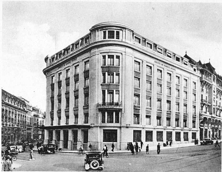
Sitz in Genf — Siège de Genève