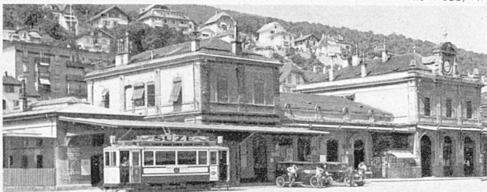
Das alte Bahnhofgebäude in Neuenburg aus den Jahren 1880–82 – L'ancien bâtiment de la gare de Neuchâtel datant des années 1880–1882