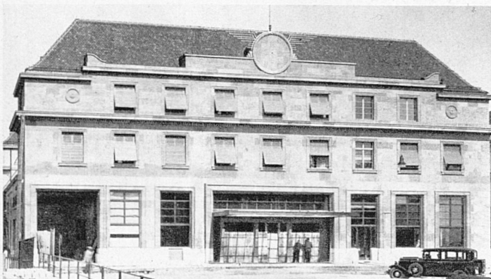
So sieht der neue eben vollendete Neuenburger Bahnhof aus – La nouvelle gare de Neuchâtel