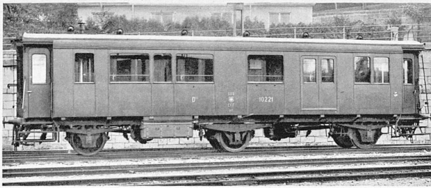
Ein dreiachsiger Krankenwagen der SBB – Wagon à trois axes des CFF destiné au transport des malades