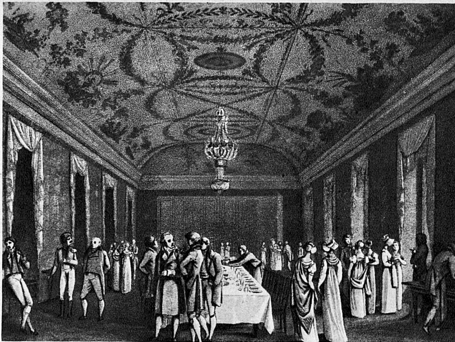
Der grosse Speisesaal in Bad Schinznach zu Beginn des 19. Jahrhunderts - La grande salle à manger des bains de Schinznach au début du XIX me siècle

Il y a 4000 ans, les habitants de la Haute-Engadine connaissaient déjà les effets bienfaisants des sources de St-Moritz, ainsi que nous le prouve la découverte d'un captage de source datant de l'époque du bronze. De nombreux vestiges de bains remontent à l'époque romaine. Plusieurs stations de cure encore connues et appréciées aujourd'hui, par exemple Baden, Schinznach, Yverdon et Lavey dans la vallée du Rhône, servaient de lieux de villégiature aux légionnaires et fonctionnaires romains chargés de garder les frontières de l'Empire et d'assumer l'administration de notre pays. Mais c'est à partir du moyen âge et de la Renaissance que les stations balnéaires suisses connurent leur plus belle période de prospérité, car à partir de ce moment la science moderne découvre peu à peu les causes chimiques de l'effet thérapeutique des sources thermales, et l'analyse scientifique permet dès lors un classement toujours plus rationnel des sources d'après leurs vertus thérapeutiques, en même temps que des cures de plus en plus appropriées et systématiques. Pendant des siècles, les cures de bains ont constitué la méthode la plus répandue et la