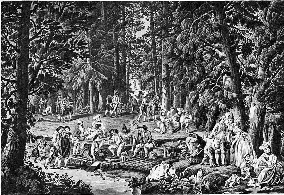
Am «Schwarzbrünnli» im Gurnigelbad. Nach einem kolorierten Stich von Zehender und Lory aus dem 18. Jahrhundert. Das erste Badehaus wurde am Gurnigel errichtet im Jahr 1591. Das Schwarzbrünnli wird neben dem ältern «Stockbrünnli» seit zirka 1728 zu Kurzwecken gebraucht – Le «Schwarzbrünnli», aux bains du Gurnigel. D'après une estampe de Zehender et Lory (XVIIIe s.). Le premier établissement de bains du Gurnigel date de 1591. Depuis 1728 environ, le «Schwarzbrünnli» est exploité à côté du «Stockbrünnli» plus ancien.

Vor 4000 Jahren schon haben die Bewohner des Engadiner Hochtals die Heilwirkung der St. Moritzer Quellen gekannt, wie uns eine bronzzeitliche Fassung beweist. Aus römischer Zeit besitzen wir Funde in grosser Zahl. Mehrere heute noch bekannte Bäder wie Baden, Schinznach, Yverdon und Lavey im Rhonetal wurden von den römischen Legionären und Beamten, die unsere Gauen schützten und verwalteten, aufgesucht. Zu höchster Blüte aber entwickelte sich das BADELEBEN in der Schweiz seit dem Mittelalter und der Renaissance, denn nun erfasste allmählich die moderne wissenschaftliche Forschung die chemischen Ursachen der Heilerfolge. Erfahrung und Erkenntnis gestat-