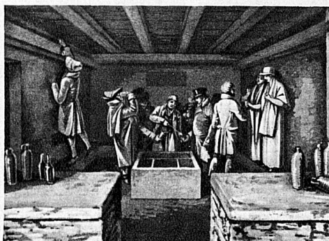
Die Trinkkur in St. Moritz um 1811. Aquatinta von F. Hegi - La cure d'eau minérale à St-Moritz, vers 1811. Aquatinte de F. Hegi