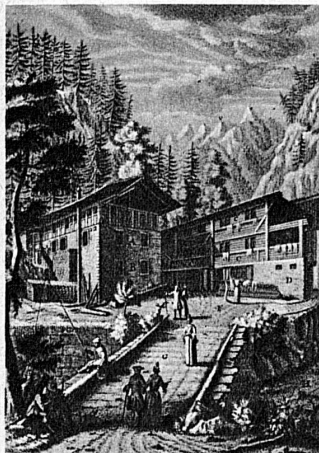
Das Weissenburger Bad im thüring. Werra- und Hainichen-Schloß, Bermer geschloß, wie es sich präsenteirt vorerstlich 1671 von Werra.

teten nun eine immer bessere Einteilung der Quellen nach ihren Heilanzeigen und eine immer systematischer durchgeführte Badekur. Jahrhundertlang war das Baden geradezu die meistgeübte und sicherste Methode im Kampfe gegen die Krankheit. Die gewaltigen neuen Erkenntnisse der Medizin haben die von Aristoteles ausgesprochene Wahrheit «Das Wasser aber ist das Beste» nicht entkräftet. Der Wert der natürlichen Heilmittel ist unzerstörbar. Und vor den mittelalterlichen und antiken Bädern haben unsere modernen Heilbäder noch das voraus, dass neben den Quellen überall die neuen, ergänzenden Kurmittel zur Verfügung stehen.