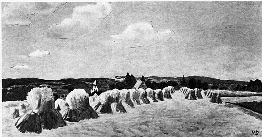
V. Surbek, Bernische Landschaft – Paysage bernois

Eine der kraftvollsten Persönlichkeiten der Schweizer Künstlergeneration, die heute in den fünfziger Jahren steht, ist der Berner Maler Victor Surbek, der sich durch eigenartige Fresken (Zeitglockenturm Bern, Städtisches Gymnasium Bern, Kurbrunnenanlage Bad Rheinfeldern) und durch seine grossgeschauten Landschaftsbilder einen Namen gemacht hat. Die Ausstellung in der Bündner Kantonshauptstadt wird Gelegenheit geben, die Reichhaltigkeit und Schönheit seiner Werke zu bewundern.