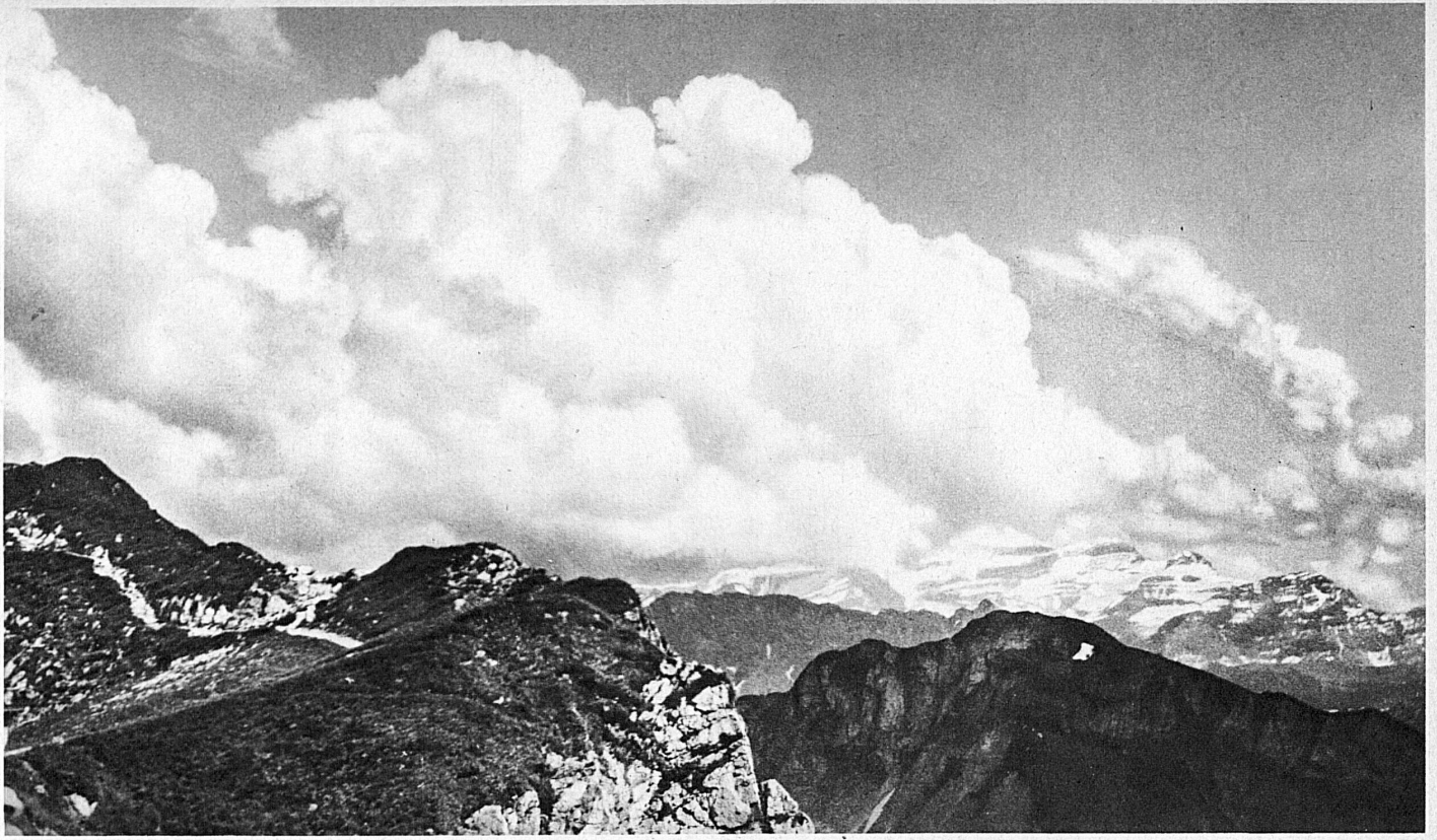
Effet de nuages au sommet des Rochers-de-Naye Auf dem Gipfel der Rochers-de-Naye