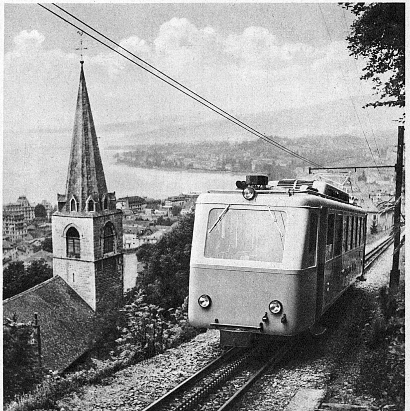
L'autorail du chemin de fer des Rochers de Naye, la baie de Montreux et l'église des Planches — Der neue Triebwagen der Rochers de Naye-Bahn, die Bucht von Montreux und die Kirche von Les Planches