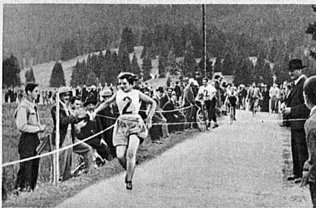
Am 7. August wird in Lenzerheide , an der grossen Postautorange von Chur ins Engadin, die jährliche Heide-Staffette durchgeführt.

schiedenen Sprachen treffen, hat unser Land die verantwortungsvolle und ehrenhafte Aufgabe, ein Brückenland in Europa zu sein zur gegenseitigen Verbindung und Befruchtung der Kulturen. Schweizer Kunst und Wissenschaft geben Zeugnis, dass dies tatsächlich der Fall war und immer noch ist. Im Rahmen des Sprachenproblems versteht Häberlin auch andere Zeitfragen, wie die der Demokratie oder Diktatur oder des Begriffes der schweizerischen Nation einzuflechten. Vor allem aber ist diese lesenswerte Schrift doch deshalb zu empfehlen, weil sie wieder einmal die Grundlage unserer Demokratie, das Nationalitäten- und Sprachenproblem ausspricht und betont, was bei den heutigen Tendenzen unserer Nachbarländer wichtig erscheint. M. G.