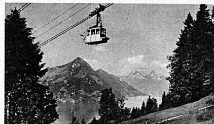
Mit der Luftseilbahn

Abitur, Handelsdiplom, moderne Sprachen, Sports. Einziges Schweizer Institut mit staatlichen Sprachkursen. Offizielles deutsches, franz. u. engl. Sprachdiplom. Maturitätsprivileg. Offizielle engl. und amerikan. Prüfungsbeurteilung. Individualisierung, Spezialabteilung f. Jüngere. Orientierungsschriften und Beratung durch die Direktion .