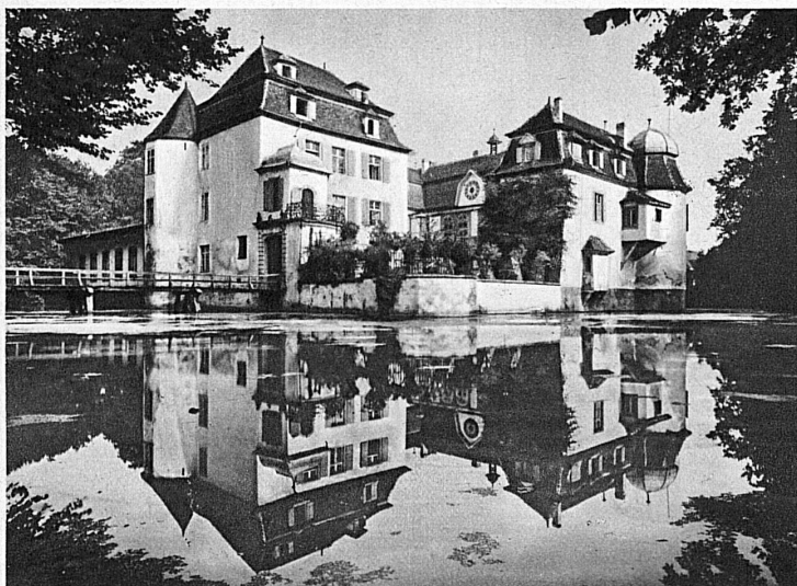
Bottmingen presso Basilea — près Bâle — bei Basel