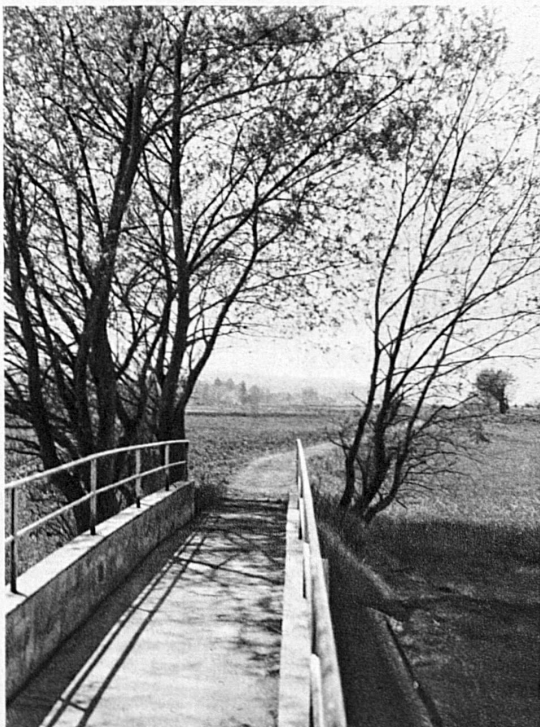
Wanderbrüggli im Tägermoos bei Tägerwilen — Passerelle près de Tägerwilen