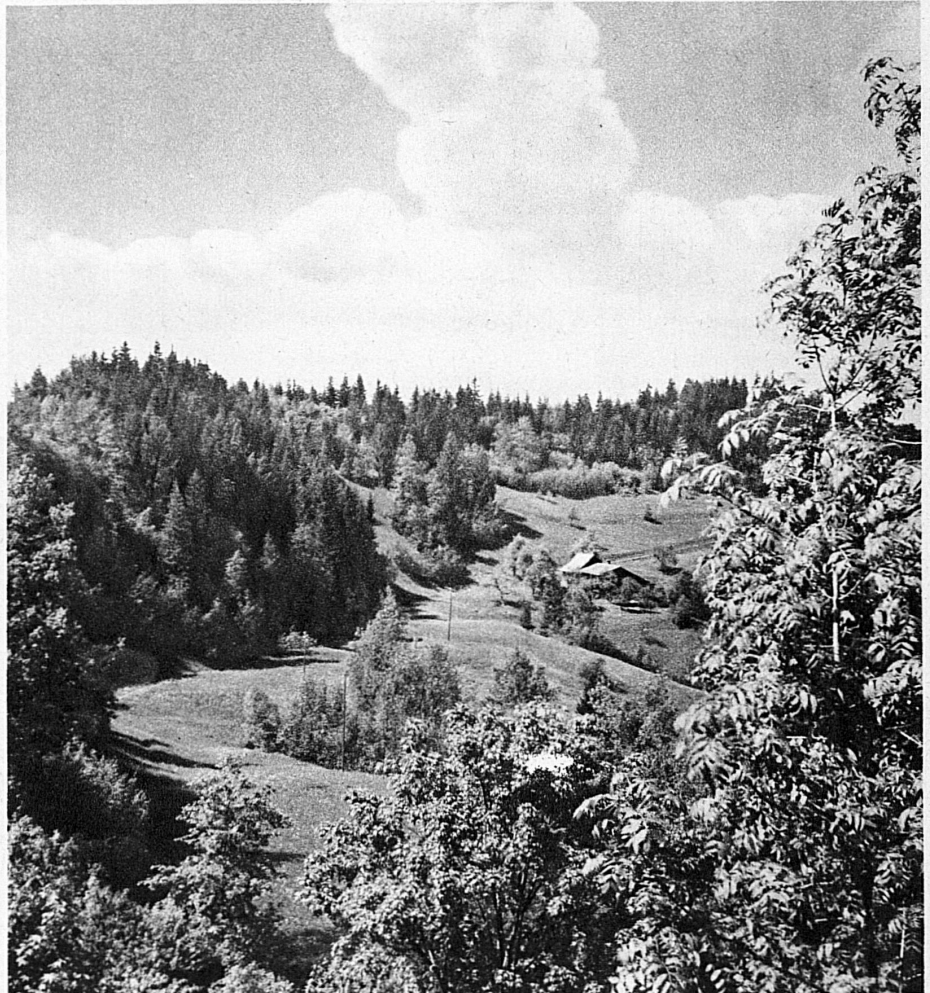
Blick vom Rotbühl im Hörnligebiet auf die « Küche » — Echappée sur le Rotbühl, dans la région du Hörnli: la « Cuisine »