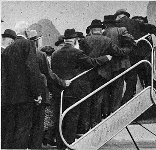
Der Andrang der unternehmungslustigen Gäste zur Flugzeugkabine ist gross — On se bouscule un peu à l'entrée de la cabine, et cela sans aucune appréhension