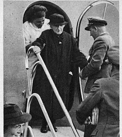
Das Personal der Swissair, Stewardess und Flugplatz-Mannschaft, sind immer zuvorkommend und hilfsbereit. Heute freuen sie sich besonders über ihren Dienst — Le personnel de la Swissair, stewardess et équipe de l'aérodrome, est toujours complaisant et prévenant, mais aujourd'hui, il a accompli son service avec un plaisir tout particulier