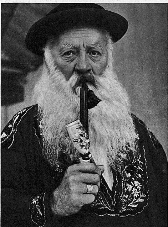
Engelberger Bauer - Paysan d'Engelberg

Vor mehr als 800 Jahren, Anno 1120, zur Zeit also, da die Kultur des Mittelalters sich im Abendland zur höchsten Blüte entfaltetete, gründete Freiherr Konrad von Seldeneburen dort, wo im Tal der Unterwaldner Aa die Wege über Surenen und Jochpass sich trennen, auf dem Engelberg, ein Kloster. Die Flurbezeichnung wurde umgewandelt in den schönen Namen Engelberg.