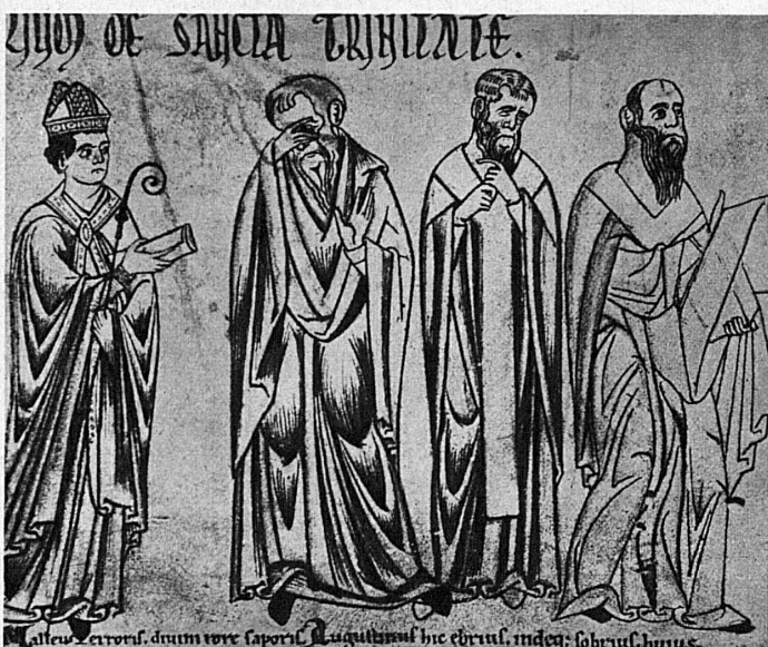
Buchillustration aus Augustins: «De Trinitate», Cod. 14 der Stiftsbibliothek, Manuskript aus den Jahren 1197/98, darstellend Augustin und drei Irrlehrer - Illustration de «De Trinitate» de St-Augustin dans le Codex 14 de la Bibliothèque, datant des années 1197/98. Représente St-Augustin et trois docteurs hérétiques