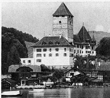
Schloss Spiez, historisches Museum — Spiez Castle, historical Museum — Le château de Spiez, musée historique