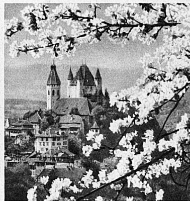
Schloss und Kirche von Thun — Thoune Castle and Church — Le château et l'église de Thoune