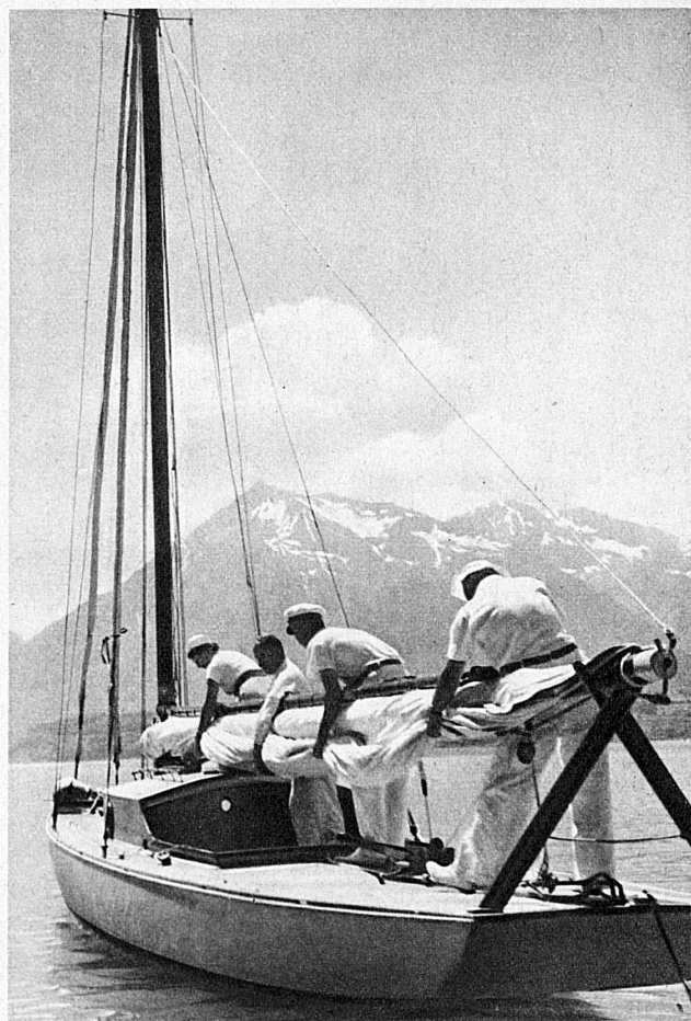
In der Segelschule Thunersee. Im Hintergrund der Niesen — The Sailing School on the Lake of Thoune. The Niesen in the background — A l'école de navigation à voile du Lac de Thoune. Au fond le Niesen

Spring-time holidays by the Lake of Thoune! There are many resorts to choose from. This year Interlaken has joined the ranks of those offering a great deal more than the mere enjoyment of spring-time scenery. Thoune and Spiez have their fine old castles, churches and chapels, as well as richly filled museums. Social and sporting events add a spice of interesting variety. Very soon, too, operations will have begun in the Lake of Thoune Yachting School, where in a few weeks the sailing enthusiast may learn all the tricks and finesses of the racing yachtsman.