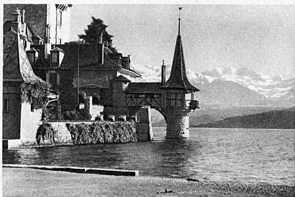
Schloss Oberhofen und die Blümlisalp — Oberhofen Castle and the Blümlisalp — Le château d'Oberhofen et la Blümlisalp