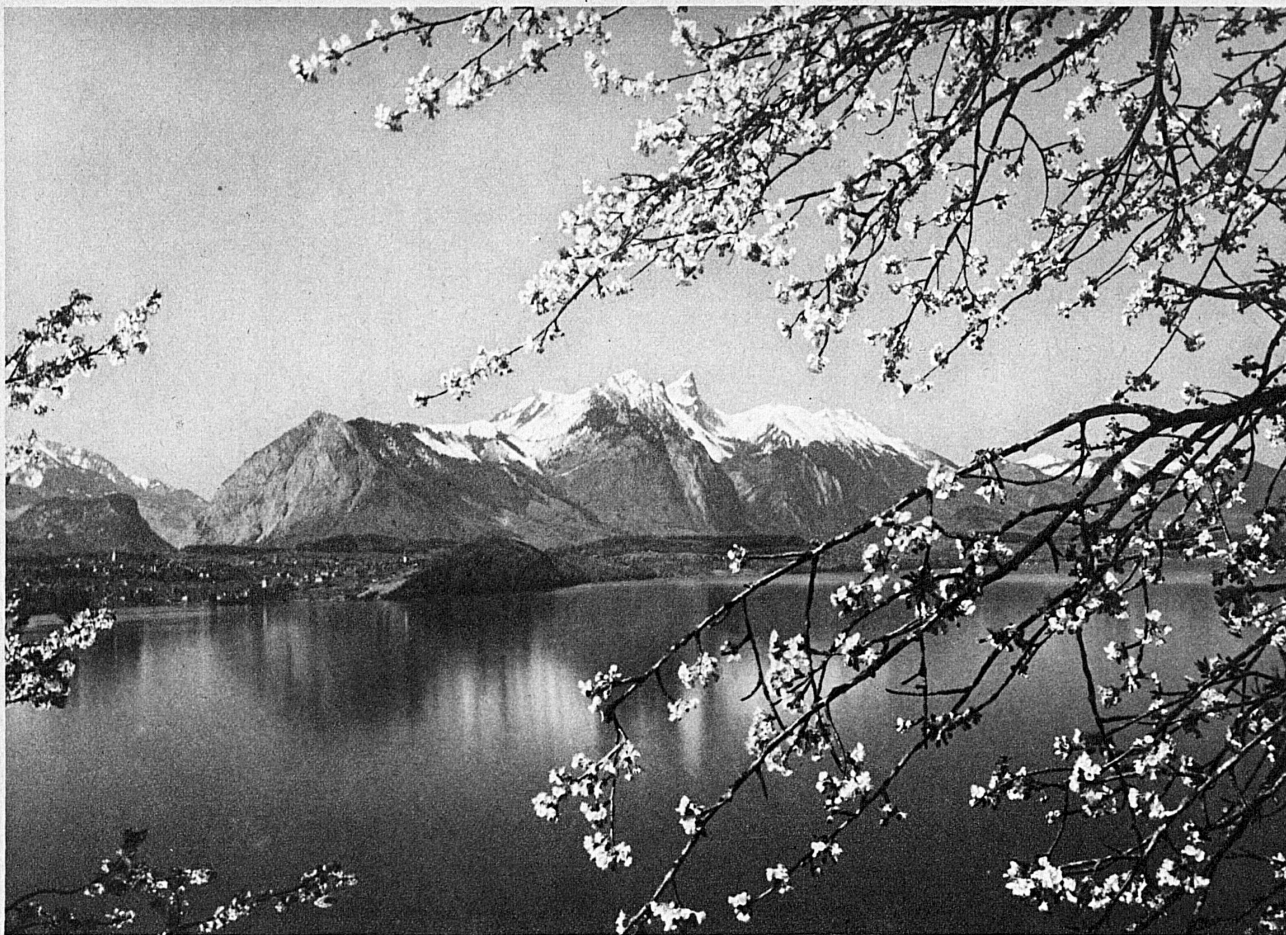
Die Stockhornkette und der Thunersee - The Stockhorn Alps and the Lake of Thoun - La chaîne du Stock- horn et le Lac de Thoune