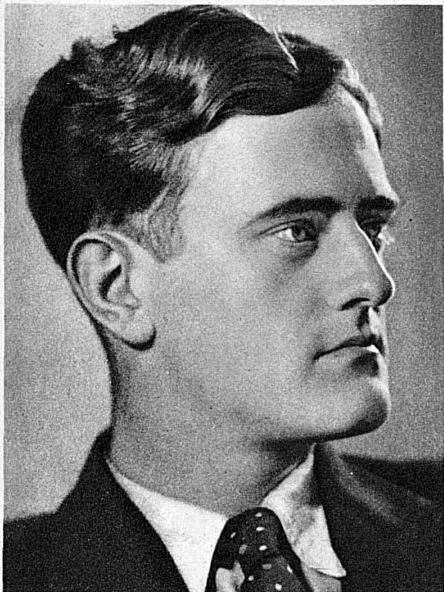
Der junge Berner Komponist Heinrich Sutermeister — Le jeune compositeur bernois Heinrich Sutermeister