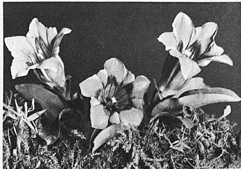
Gentians — Gentianes — Enzianen