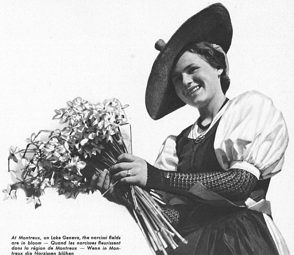
At Montreux, on Lake Geneva, the narcissi fields are in bloom — Quand les narcisses fleurissent dans la région de Montreux — Wenn in Montreux die Narzissen blühen

Springtime in Switzerland combines three seasons — that of the South, the Lowlands and the Alps. Each is different, but equally lovely: the rich garden and wild flowers in the Ticino and on the shores of the Lake of Geneva, the glowing wealth of blossom in the extensive orchards between the Alps and the Jura, and the multi-coloured flora of the mountain pastures. At the end of February and the beginning of March spring crosses the country's southern and western frontiers. In April and May its incomparable charm pervades all the hills and lakeside districts; and in June it ascends the mountains right up to the very snowline. This year the most important flower festival, the Camelia fete at Locarno will take place on Mai 28 th .