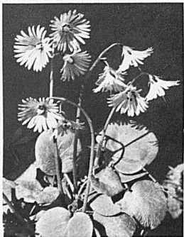
Soldanellas — Soldanelles — Soldanellen