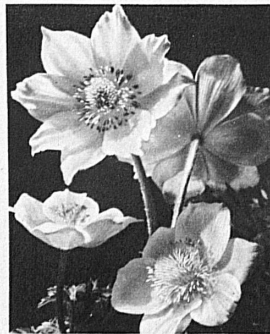
Alpine anemones — Anémones des Alpes — Alpenanemonen

Springtime in Switzerland combines three seasons — that of the South, the Lowlands and the Alps. Each is different, but equally lovely: the rich garden and wild flowers in the Ticino and on the shores of the Lake of Geneva, the glowing wealth of blossom in the extensive orchards between the Alps and the Jura, and the multi-coloured flora of the mountain pastures. At the end of February and the beginning of March spring crosses the country's southern and western frontiers. In April and May its incomparable charm pervades all the hills and lakeside districts; and in June it ascends the mountains right up to the very snowline. This year the most important flower festival, the Camelia fete at Locarno will take place on Mai 28 th .