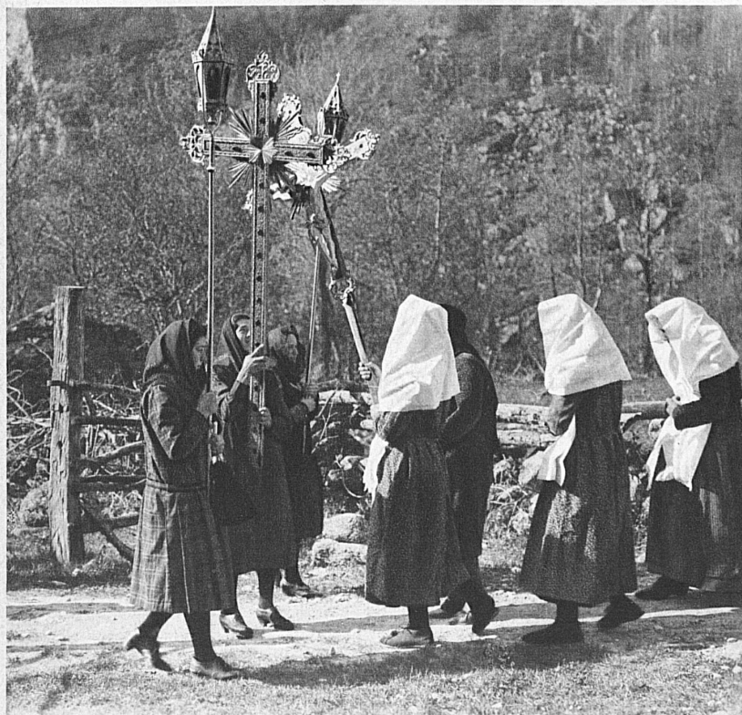
Il « bacio » dei crocifissi — Le « baiser » aux crucifix — Der « Kuss » der Kruzifixe

Ora tutto è tranquillo, silenzioso, ma sveglia. Fumano, azzurri, qua e là, alcuni camini: lentamente, lievemente, che appena si vede. Le case, per la maggior parte, devono essere deserte, o quasi. Uomini e donne sono già in chiesa: