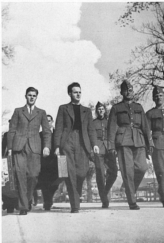
Junge Bürger rücken zur Rekrutenschule ein — Ein Mann vom Landsturm

Aus der Erklärung des Bundesrates in der Bundesversammlung, 21. März 1938.