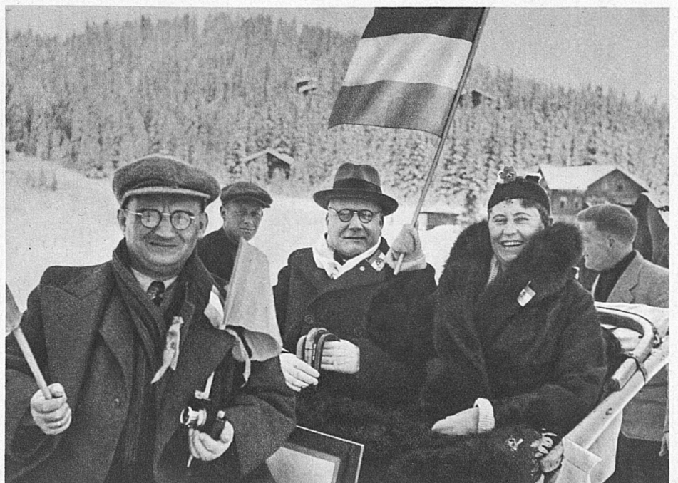
Jolige vacantiestemming bij de Nederlanders — Fröhliche niederländische Wintergäste