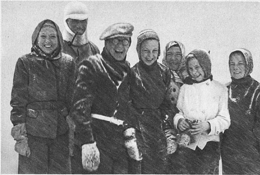
In een sneeuwbus kijkt Jong-Holland toe — Im Schneegestöber schaut Jungholland zu

zu den holländischen Skimeisterschaften in Arosa, 13.-15. Januar 1939