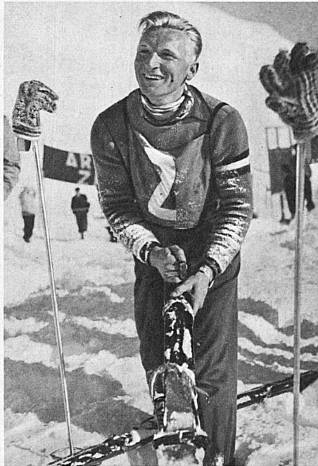
Kees Kerdel, Hollandsch skikampioen 1938 — Kees Kerdel, Hollands Skimeister 1938