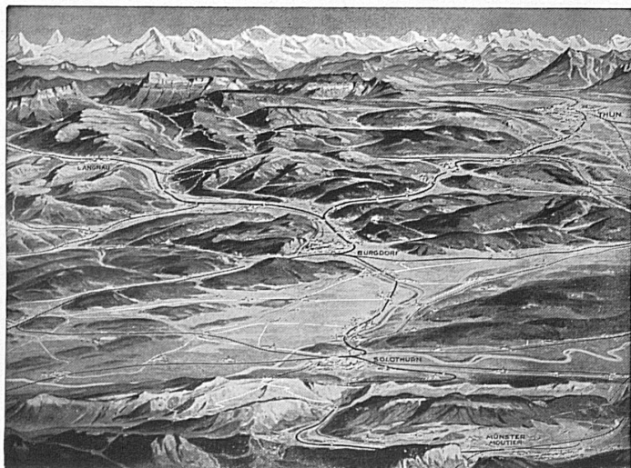
Blick von den Jurahöhen des Weissensteins nach Süden - Ausgangspunkte: Stationen Gänsbrunnen und Oberdorf (Solothurn) - Autokurs Gänsbrunnen-Weissenstein. Sonntagsbillette zu reduzierten Preisen