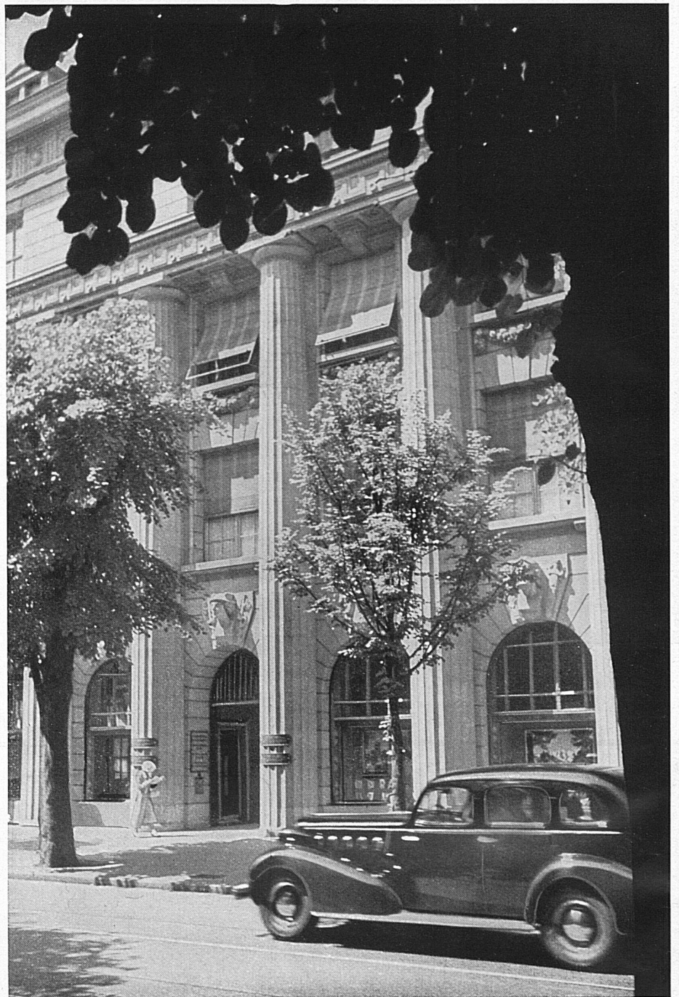
Eingang zum Bankgebäude in Zürich

Les prix indiqués sont ceux du voyage aller et retour par train spécial, surtaxe pour trains directs comprise. Toutefois, dans la plupart des cas, on peut obtenir des billets valables pour l'aller par train spécial et pour le retour individuel dans les dix jours, ou inversement, pour l'aller individuel la veille et le retour par train spécial. Les gares d'où l'on peut atteindre le train spécial au moyen des trains ordinaires, délivrent aussi des billets au prix du train spécial. - Pour certains voyages en société des billets valables pour le retour individuel dans les 10 jours sont souvent également délivrés. Pour tous renseignements relatifs à ces billets, arrangements à forfait (pour voyages en société de plusieurs jours), etc., s'adresser aux Bureaux de renseignements Voyages-Excursions dans les principales gares des C F F.