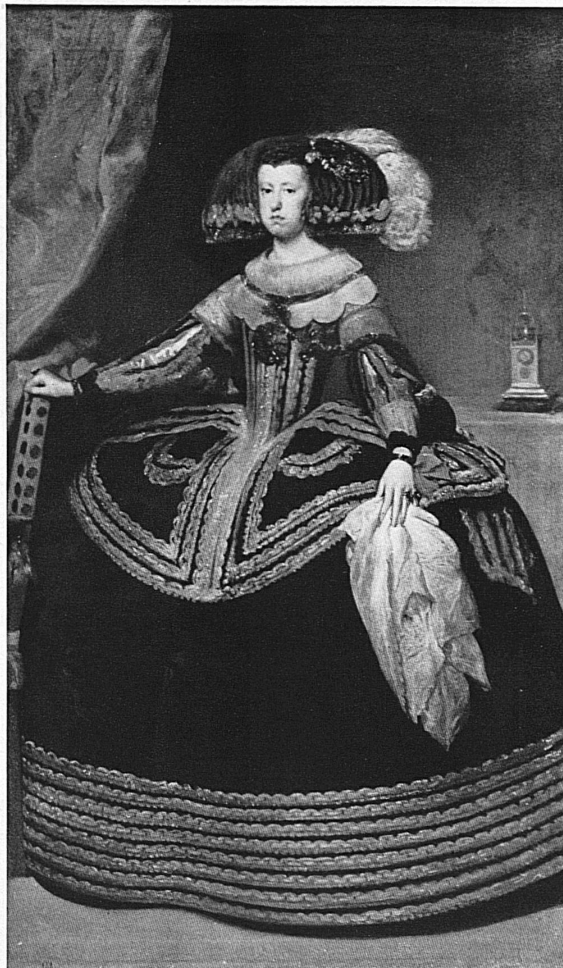
Portrait de Marie-Anne d'Autriche, femme de Philippe IV, par Velasquez

11. Juni: Bern - Thun - Bern, in Verbindung mit der Ausgabe von Tageskarten für die Dampf- und Motorschiffe des Thuner- und Brienzensees, sowie für die Bahnstrecke Interlaken Bhf. - Interlaken-Ost - Bönigen. Preis der Tageskarte Fr. 5.75. Zu diesem Extrazug werden ausserdem Spezialbillette Bern - Mülönen und zurück à Fr. 3.65 und Mülönen - Niesen-Kulm und zurück (inkl. ein Mittagessen im Hotel Niesen-Kulm) à Fr. 7.25 ausgegeben. - 11. Juni (Segensonntag im Lötschental): Bern - Niesen-Kulm - Reichenbach, Frutigen, Kandersteg, Goppenstein und Brig. Fahrpreis 3. Kl. ab Bern nach Niesen-Kulm Fr. 8.10, Reichenbach Fr. 3.70, Frutigen Fr. 4.20, Kandersteg Fr. 5.95, Goppenstein Fr. 7.90, Brig Fr. 10.20. Es werden auch 2- und 10-tägige Billette ausgegeben.