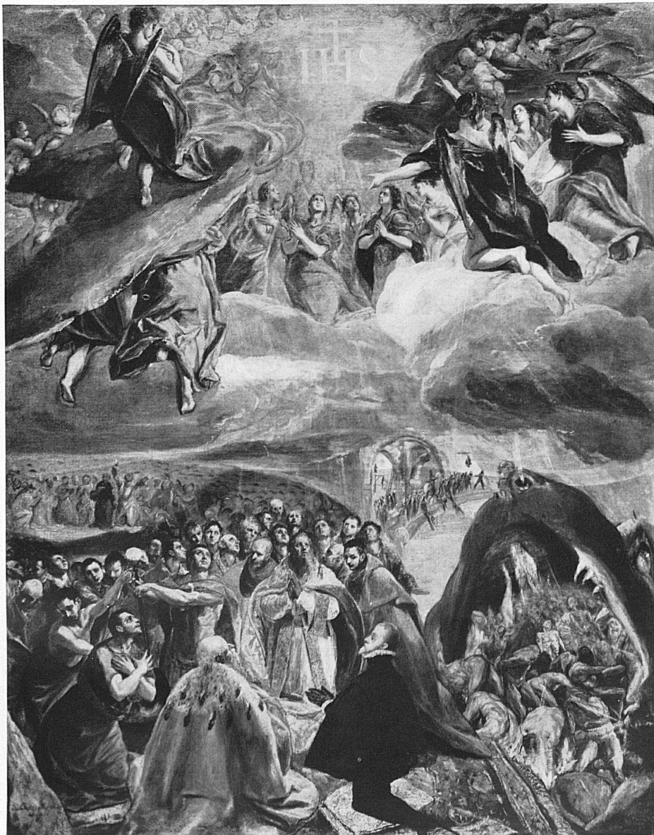
Greco: Le songe de Philippe II — Das Gesicht Philipps II. (Escorial)

voilà tout Goya en trois mots. Sentir, c'était déjà pour lui agir; agir, c'était se débrouiller; et comprendre, c'était se persuader d'agir encore et de plus belle. Toutes ces puissances se déclenchaient en lui si vite qu'elles en arrivaient à travailler de concert. Et c'est me semble-t-il, un beau miracle sombre que de créer comme Goya l'harmonie dans la violence. Ajoutez que dans toute scène de la vie, volontiers il retrouve les grands traits d'un drame éternel. Alors, enveloppée tout à coup d'un éclat mystérieux, et qui la recule devant son esprit, sans la reculer dans l'espace, la réalité lui apparaît proche et lointaine. Or le point de vue d'un Goya, toute l'école espagnole le justifie. Visiblement, pour elle, une œuvre n'est belle que si, participant de deux mondes à la fois, elle procède de deux visions, l'une qui enregistre le réel, et l'autre qui le transfigure en le ramenant à une vue de l'esprit. Autant dire qu'alors l'art met en jeu, par voie de transmission, toutes les énergies de l'homme et pour conclure entre elles un pacte éblouissant où la violence de leur conflit se reconnaît aux perfections de leur accord.