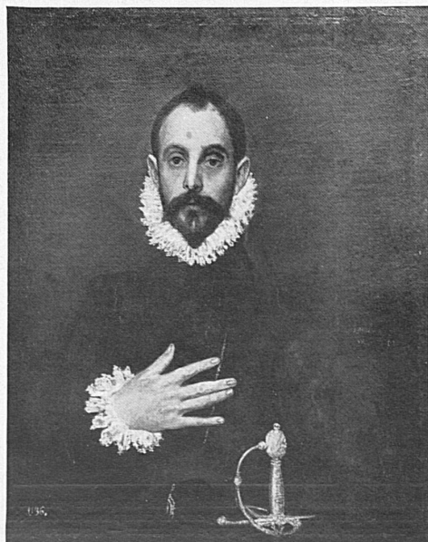
Greco: Le chevalier à la main sur le cœur — Der «Ritter mit der Hand auf dem Herzen» (Prado)