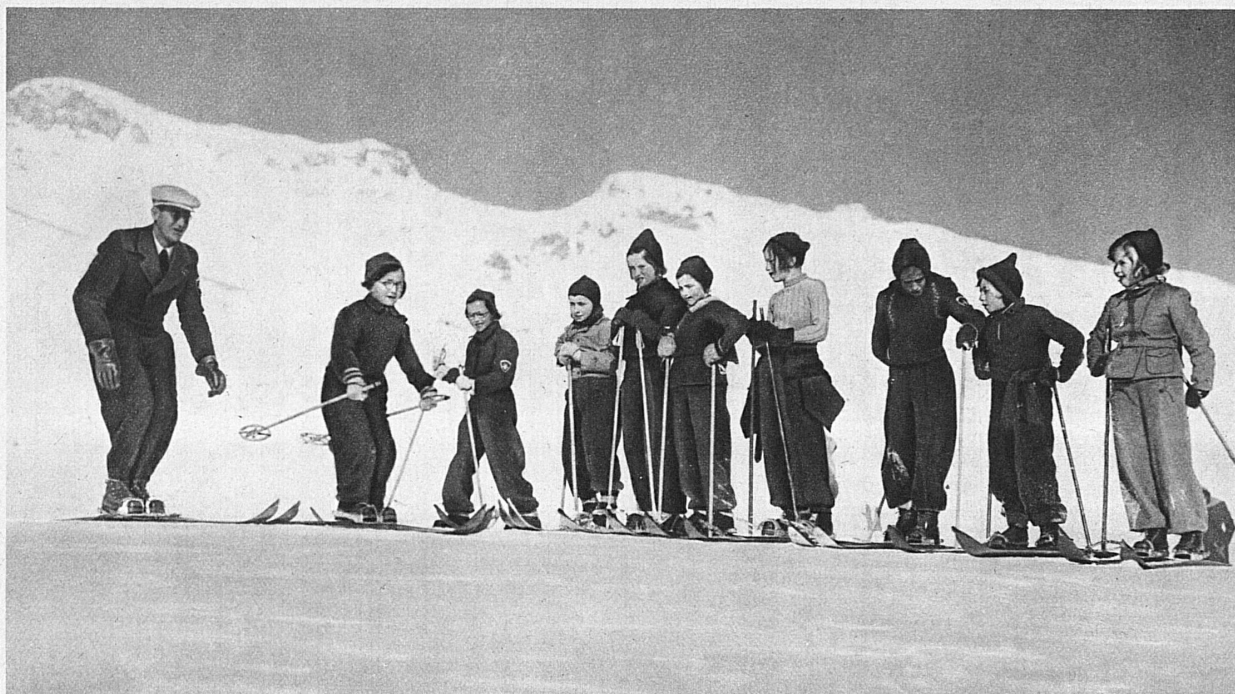
Classe d'enfants à l'école de ski de St-Moritz (Engadine) — Children's Class at St. Moritz Ski School (Engadine) — Kinderklasse der Skischule St. Moritz (Engadin)