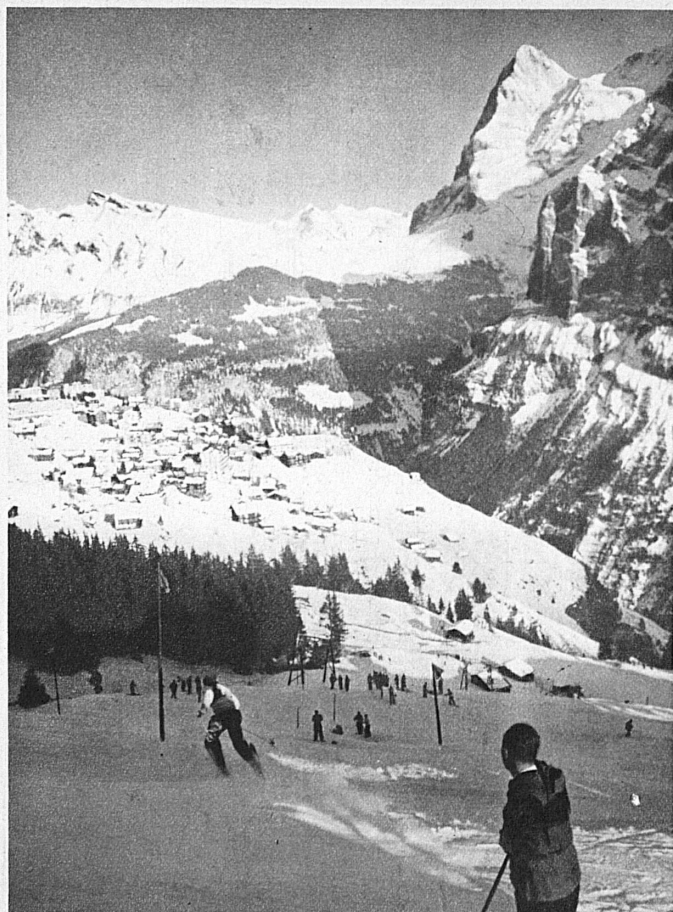
Avec ses pentes abruptes, Mürren, dans l'Oberland bernois, semble le lieu prédestiné aux courses de descentes - Au fond, à gauche, le Wetterhorn; à droite, l'Eiger - Mürren, in the Bernese Oberland, is ideal racing country. In the background: Left the Wetterhorn, right the Eiger - Mürren im Berner Oberland ist mit seinen rässigen Abfahrten ganz besonders für das Rennfahren prädestiniert. Im Hintergrund: links das Wetterhorn, rechts der Eiger