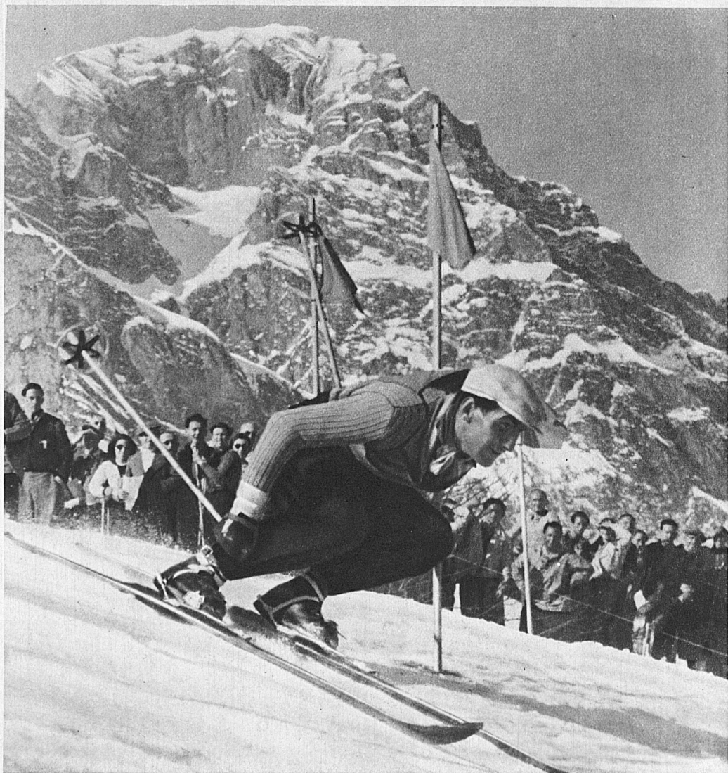
Rudolf Rominger, champion mondial de slalom, lors de sa victoire de 1938, aux courses d'Engelberg (Suisse centrale) - Rudolf Rominger, world champion, competing in his victorious slalom: FIS Races 1938 in Engelberg (Central Switzerland) - Weltmeister Rudolf Rominger bei seinem Siegeslalom an den FIS-Rennen 1938 in Engelberg (Zentralschweiz)