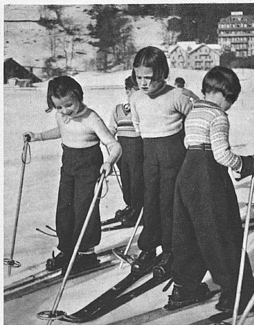
Dans la classe enfantine de ski, à Wengen (Oberland bernois) — The Children's Ski Class at Wengen (Bernese Oberland) — In der Kinderskiklasse in Wengen (Bernser Oberland)

Every ski-er knows that, however much he learns, he still falls short of perfection. Even the famous « cracks » realise this fact and come back from time to time for a « brush-up » in the Ski School. That is why, besides the children's classes and those for adult beginners and proficient ski-ers, special racing classes have also been organised. The results speak for themselves, for these racers' courses have made more than one champion out of an inveterate « also-ran ».